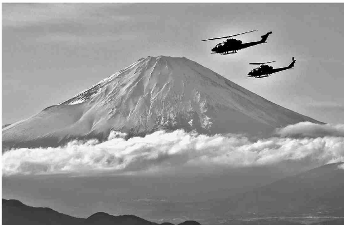
富士山をバックに飛行するAH-1S

東部方面航空隊は1月17日、立川駐屯地及び周辺空域において、総監視頭に当たり、編隊飛行訓練を実施し、編隊行動能力を向上させた。