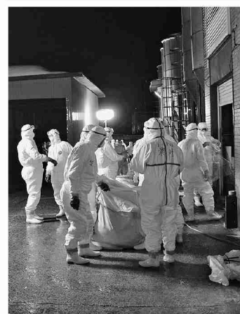
運搬作業を実施する第30普通科連隊の隊員