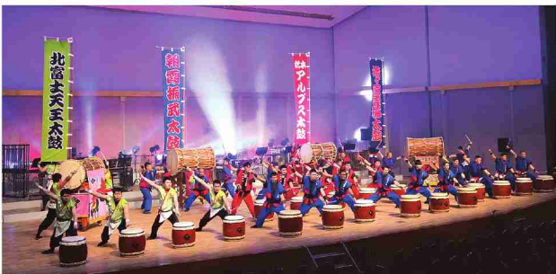
轟音を響かせる東方自衛太鼓