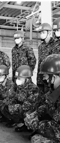
工具の使用法を学ぶ新隊員