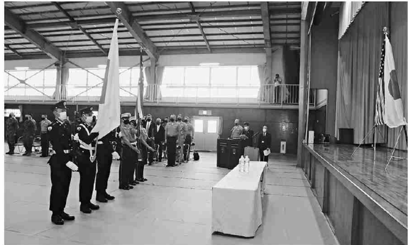
国旗を奉じる日米両国隊員

第34普通科連隊は12月10日、硫黄島協会及び米硫黄島協会(元米国退役軍人会)が共催する日米硫黄島戦没者合同慰霊追悼顕彰式に防衛省自衛隊を代表し、旗衛隊として参加した。 追悼顕彰式は硫黄島において散華された日米両国の英霊を慰霊・顕彰し、その冥福を祈念することを目的としている。硫黄島戦50周年である平成7年に第1回が開催されたから今回で23回目となる。当日は英霊に対