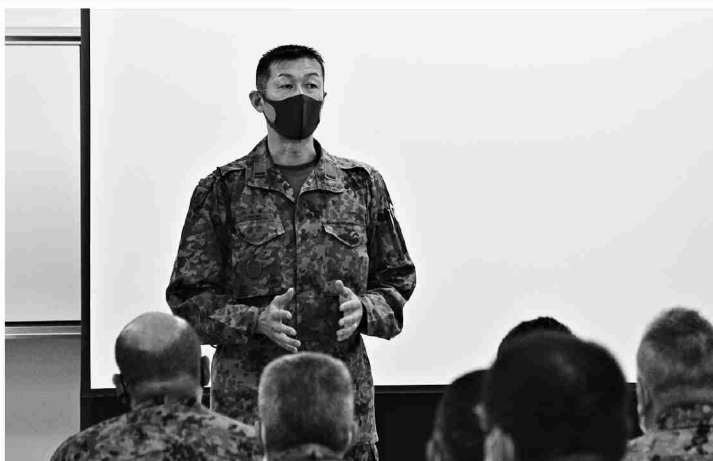
施策を説明する方面最先任

方面隊は1月18日・19日、朝霞駐屯地に方面最先任上級曹長等会を実施した。本会同は総監企図の徹底を図り、方面施策説明、各部隊からの情報提供及び最先任系統の討議により情報を共有するとともに、今後の業務の資を得ることを目的とし、方面隊下各部隊から最先任上級曹長等が参加した。