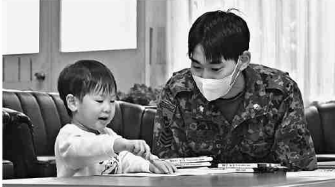
家族イベントを楽しむ1通大