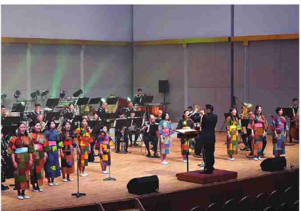
澄んだ歌声で魅了する合唱団との共演