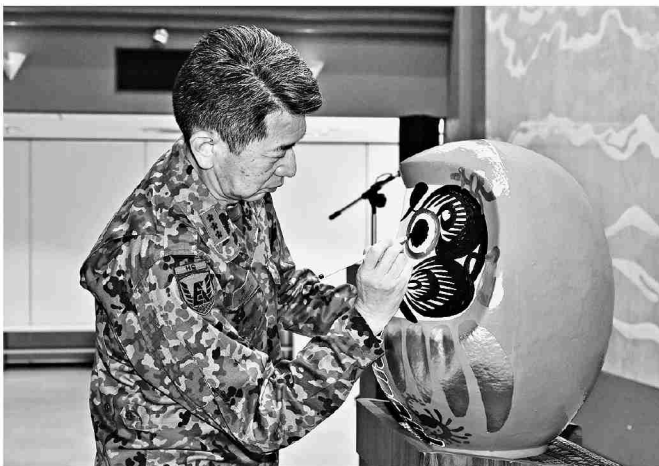
だるまに目入れをする総監