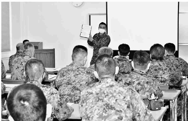
討議内容を発表する参加者

会同では総監訓話、方面施策説明、各部隊情報提供、グループ討議及び意見交換が実施された。訓話において総監は皆が実施すべきことは2つあり、1点目は「上意下達、下意上達」である。部下に意思を伝えることは「熱伝導」と同じで、指揮官がどんなに熱意を持って部下に意思を伝えようとしても、その間にいる隊員が同じように熱をもって伝えないと、末端に届くころには冷めた内容となり、十分に指揮官意図が伝わらない。指揮官を補佐するため熱意をもった指導をして欲しい。また自分の部下が困っていないかについてもよく掌握し、指揮官に伝えて欲しい。2点目は後輩の人材育成である。部下に関心を持ち、良好な人間関係を築きながら一歩踏み込んだ指導により、自分たちの後輩を自分たちの手で育てて欲しい。以上2点を重視しつつ、自分の理想とする最先任