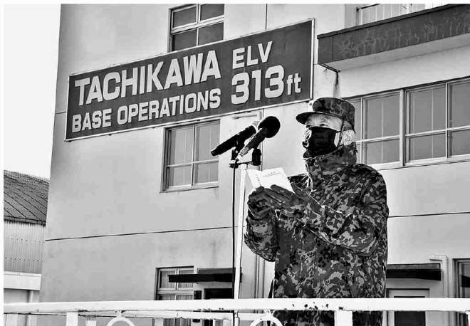
訓練開始式で訓示を述べる航空隊長