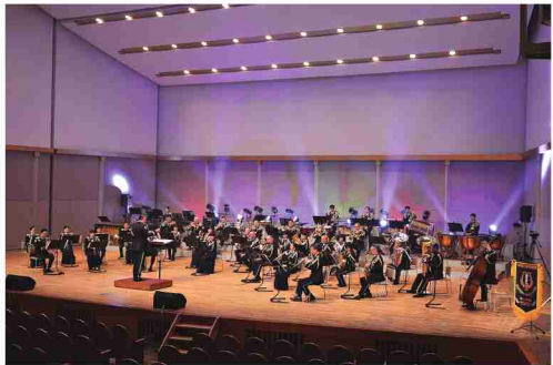
迫力の演奏を披露する東方音