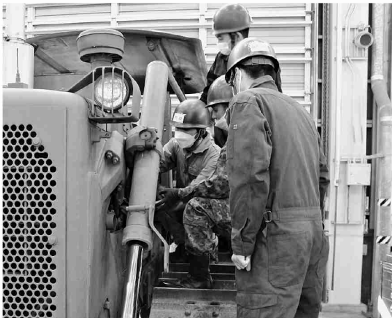
中型ドーザの整備要領を学ぶ新隊員

東部方面後方支援隊は1月10日から勝田駐屯地において、令和4年度陸士特技課程「施設機械整備」教育を開始した。本教育は施設教育直接支援中隊が担任し、東方後支隊の他、第1後方支