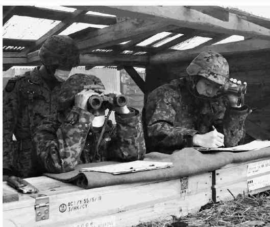
射撃の観測をする隊員

第1特科隊は12月12日から16日までの間、北富士駐屯地、富士駐屯地及び東富士演習場において令和4年度師団観測者集合訓練を実施した。目標位置の決定、射撃の修正等の観測能力向上を目的として、指導者グループと観測者グループに分かれ、指導者能力及び練度の向上を図った。