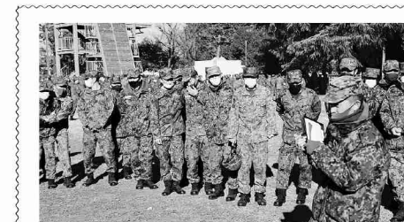
サークル活動の初顔合わせ

の重奏であり、本演奏会は10組による演奏が行われた。パートごとに分かれた演奏や、小編成の重奏に会場に集まった大勢の観客は大きな拍手を送った。