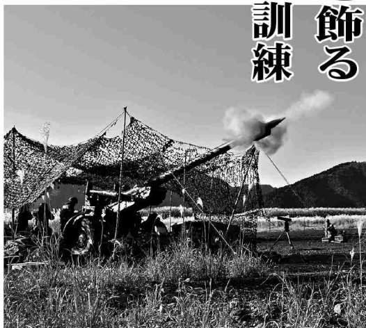
第12特科隊として最後の実弾射撃

本訓練は実弾射撃の練度を維持・向上させる目的で射撃を、また特科大隊としての行動を演練