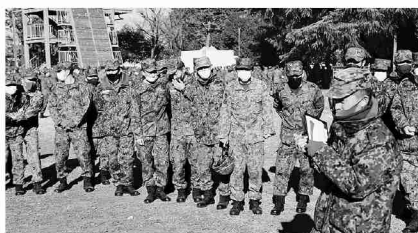
サークル活動の初顔合わせ

練馬駐屯地では部隊間の垣根を超えた交流を通じて融和団結を促進するとともに、さらなる業務の円滑化を図る目的で、全隊員を対象に既存のサークルから大幅に拡充した86コのサークルを立ち上げた。