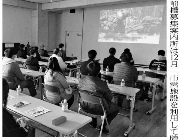
教育風景動画を視聴する参加者

自衛隊群馬地方協力本部前橋募集案内所は12月17日・18日の両日、前橋市営施設を利用して陸・海・空自衛隊合格者説明会を実施した。 本説明会は入隊案内が配布される前から入隊に必要な準備を進めてもらうことを目的に、男女別日程で教育隊の概説・若年隊員との懇談・自衛隊家族会紹介の3部構成で毎年実施しているものであり、採用試験合格者及びその家族の計37人が参加した。 当日は前橋所長による合格の祝辞から始まり、教育隊の概説では、着隊までの注意事項や入隊から部隊配属の流れに焦点を合わせた説明を実施した。若年隊員との懇談では、近傍部隊から隊員を