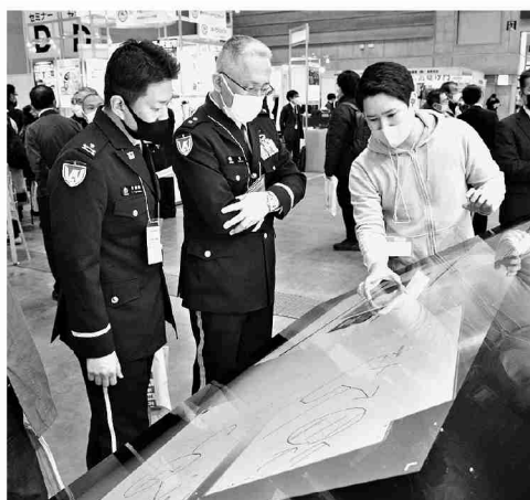
最新の装置の説明を受ける総監部幕僚長

方面隊は1月20日、都内において東部方面隊東校会主催の防衛講話に協力し、方面隊への信頼感の醸成及び自衛隊の活動に関する理解の深化を図るとともに、防衛思想の普及啓蒙を促進した。総監はわが国を取り巻く安全保障環境、昨年12月16日に発表された戦略3文書の概要、将来の陸上防衛力等について講話をし、東校会及びオピニ