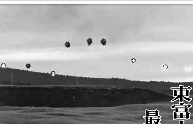
射撃訓練の最後に行われたFH-70X 9門による同時弾着射撃

第12特科隊は12月2日から10日までの間、東富士演習場において令和4年度第4回隊野営訓練を実施し、方面特科連隊の新編を控え、12特として最後の実弾射撃訓練に臨んだ。