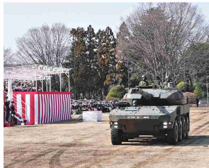
観閲台の前を威風堂々と進むMCV

「克己」を胸に向上心をもって各人の戦闘能力を磨くとともに、温かい心をもって次の時代を担う後輩を育て、如何なる事態に対しても即応して任務を完遂し得るよう執念をもって挑戦し続けることを要望する」と述べた。 続いて隊員食堂において東部防衛協会、東部方面懇話会及び東部方面隊東校会が主催する祝賀会食が実施された。多数の招待者等が参加し、約1時間の懇談により交流を深め、会は盛況裏に終了した。