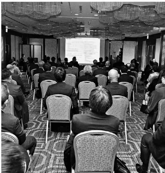
総監講話を熱心に聴講する参加者

方面隊は1月20日、都内において東部方面隊東校会主催の防衛講話に協力し、方面隊への信頼感の醸成及び自衛隊の活動に関する理解の深化を図るとともに、防衛思想の普及啓蒙を促進した。総監はわが国を取り巻く安全保障環境、昨年12月16日に発表された戦略3文書の概要、将来の陸上防衛力等について講話をし、東校会及びオピニ