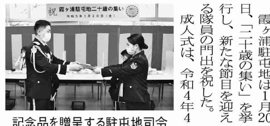
記念品を贈呈する駐屯地司令

霞ヶ浦駐屯地は1月20日、「二十歳の集い」を挙行し、新たな節目を迎える隊員の門出を祝した。成人式は、令和4年4月2日から令和5年4月1日までの間に二十歳を迎える隊員を対象に実施された。