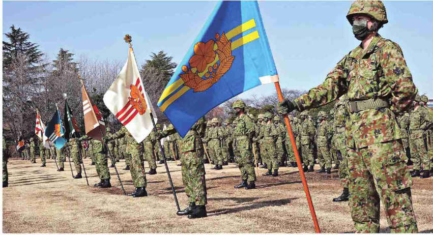
整列した観閲部隊

方面隊は2月11日・12日の両日、朝霞駐屯地等において方面隊創立63周年記念行事を挙行了。本行事は協力者等からの信頼の醸成及び隊員の使命の自覚と士気の高揚を図り、防衛基盤の充実強化に資することを目的としている。 11日は優秀隊員招待行事、方面音楽まつり、歴代総監会同を、12日は総監感謝状贈呈式、祝賀式典、祝賀会食をそれぞれ実施した。 優秀隊員招待行事においては当初都内外部施設において表彰式を実施し、各部隊等の隊務運営や方面隊の精進に多大な貢献をした優秀隊員16人に対し、総監は表彰状を授与し、その功績を称えた。その後、和光市民文化センターサンアセリアで行われた方面音楽まつりを鑑賞し、受賞者の隊員家族も演奏会を楽しんだ(下部参照)。 歴代総監会同では総監が歴代の元総監と懇談し、方面隊の現況を伝えるとともに、さまざまな意見を聴取して今後の方面隊の施策の資とした。総監感謝状贈呈式では功績の著しい個人及び団