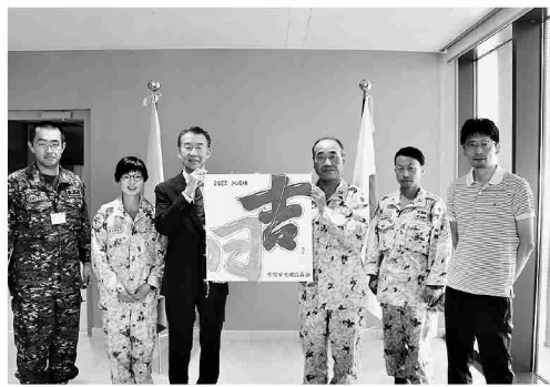
特命全権大使を表敬