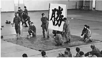
今年の一文字で盛り上がる34普連

第1師団司令部及び各隷下部隊では、久しぶりとなる年末行事を行い、隊員たちの明るい笑顔が見られた。令和4年は北海道矢野別演習場で行われた北海道訓練センター1訓練や中重砲訓練、国家的行事や災害派遣等、隊員たちにとっても忙しい日々を過ごしてきた。そんな隊員のために各部隊では趣向を凝らし、さまざまなイベントが行われ、1年間の労をねぎらった。