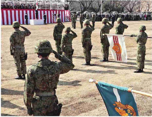
国旗に敬礼する観閲部隊