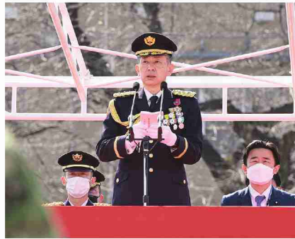
式辞を述べる総監

方面隊は2月6日、都内においてJAXA(宇宙航空研究開発機構)が事務局を務める衛星地球観測コンソーシアムからの依頼による対談に協力した。