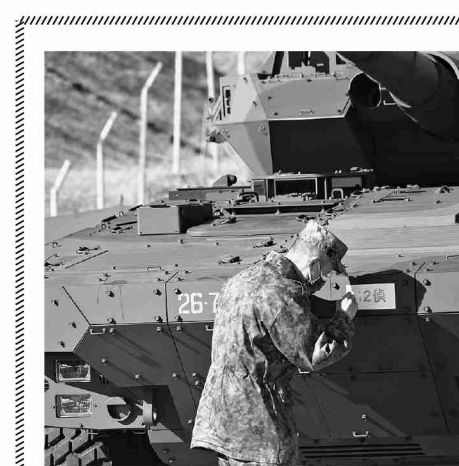
MCVに部隊名を書き込む第12偵察隊長

し、改編後の戦力化を促進する目的で実射練成訓練及び大隊陣地占領訓練を実施した。訓練は当初、大隊陣地占領訓練が実施され、演