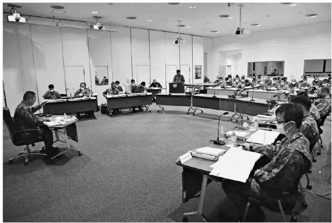
隊計1次指示の様子

1月10日、初顔合わせが実施され、師団長も「健康麻雀同好会」に加入する等、隊員との交流を図った。人気サークル第1位は、フットサル同好会であった。