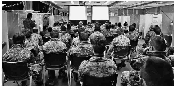
訓練終了後の研究会

隊は引き続き、訓練部隊のニーズに最大限に応えつつ、訓練支援の質的向上を図り強靱な東部方面隊の創造に最大限寄与する。