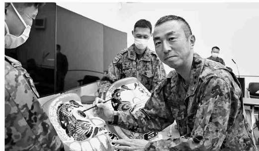
だるまに目入れをする旅団長

写真上段：浅間山を背に年初飛行を実施する第12ヘリコプター隊のUH-60及びCH-47 写真下段左から：綱引きをする第12偵察隊 安全祈願をする第12特科隊 ハイポートをする第12対戦車中隊 大縄跳びをする第13普通科連隊