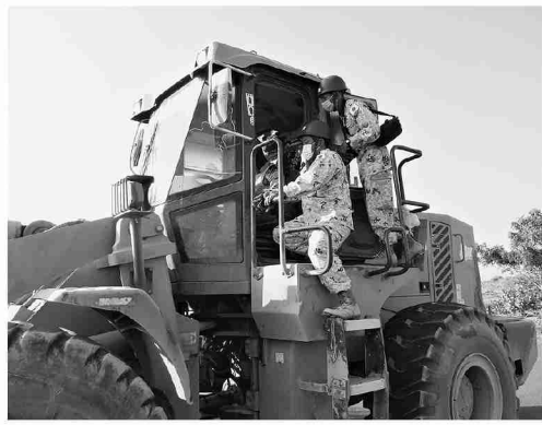
操作教育(バケット走行)

この間、派遣団長以下3人は在ジブチ共和国特命全権大使大塚氏を表彰し、教育の進捗状況等について報告後、近隣の学校で現地の子どもたちと「座間の大風」をあげるなどの文化交流を実施した。