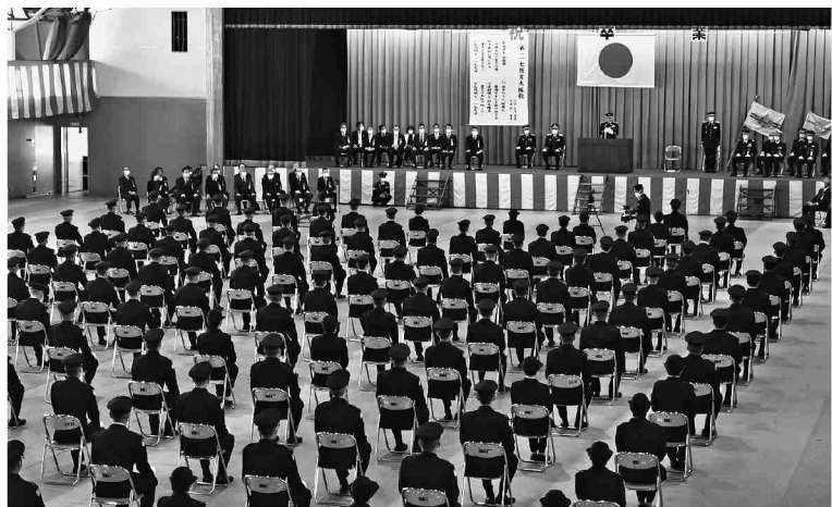
式辞を述べる大隊長