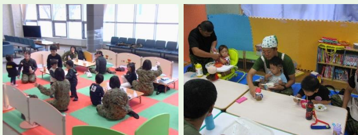
自衛隊施設で子ども達を預かる様子