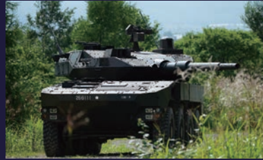
第10即機連隊に装備 105mm施線砲等を搭載する戦闘車であり、高い機動力を有する。 乗員：4名 重量：約26t 最高速度：100km/h以上