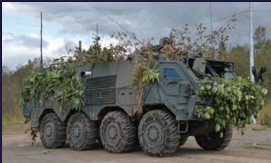
第11特殊武器防護隊に装備 化学・生物・核汚染下の状況で行動し、各種センサーや試験採取用マニピュレーターにより有毒ガスや放射線に対する偵察活動を行う。 乗員：4名 重量：約14t 最高速度：95km/h