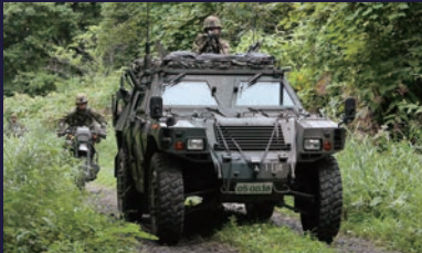
第10即機連、第18、28普通科連隊等に装備 軽装甲、高機動力性を備え、多様な任務に対応できる。 乗員：4名 重量：約4.5t 最高速度：約100km/h