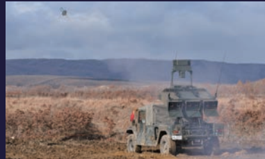
第10即機連、第18、28普通科連隊に装備 高機動力車に搭載する多目的誘導弾であり、優れた機動力性と即応性を有する。 乗員：3名 重量：約3.9t（車両・誘導弾等）