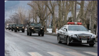
国際平和協力活動等