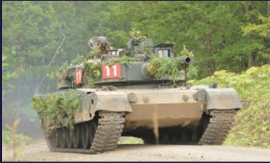
第11戦車隊に装備 120mm滑腔砲を搭載する陸自の第3世代戦車で高い機動力と防護力を有する。 乗員：3名 重量：約50t 最高速度：約70km/h