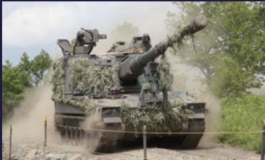
第11特科隊に装備 長射程の火力を発揮する自走式のりゅう弾砲であり、機動力性に優れ、防護力を有する。 乗員：4名 重量：約50t 最高速度：約50km/h