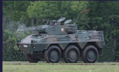
第11偵察隊に装備 25mm機関砲や微光暗視装置を備え、敵の脅威下での偵察警戒任務を可能にする。 乗員：5名 重量：約15t 最高速度：100km/h