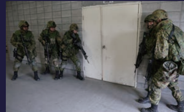
胆振東部地震における災害派遣