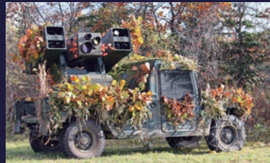
第11高射特科隊に装備 画像・赤外線誘導方式の誘導弾で主として低空空域の飛行目標に対応する。 乗員：3名 重量：約14t 最高速度：95km/h