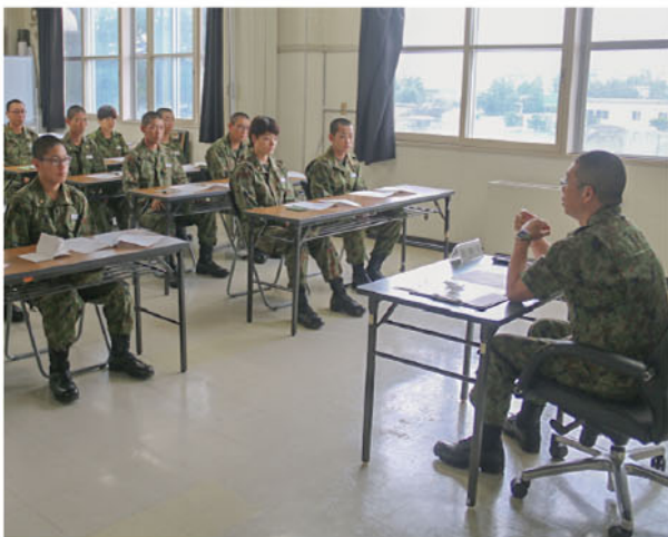
連隊長による教育