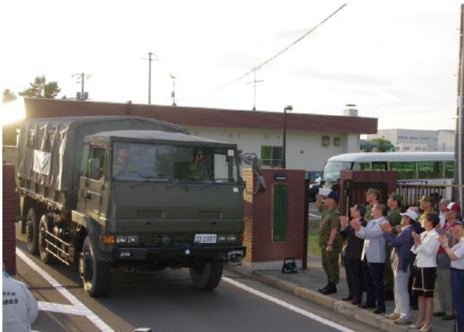
鳥松駐屯地を出発する入浴支援隊(NALog)