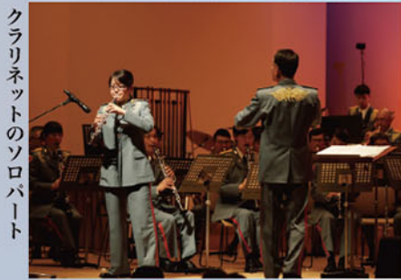
クラリネットのソロパート