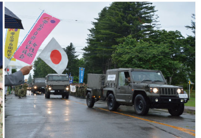
帯広駐屯地を出発する入浴支援隊(5B)