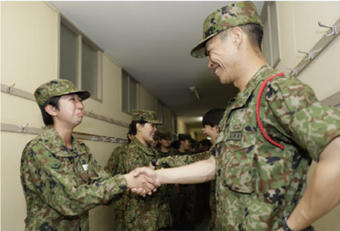
見送られる新隊員