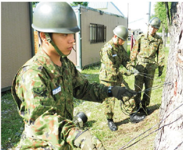
通信科後期教育（有線縛着要領）