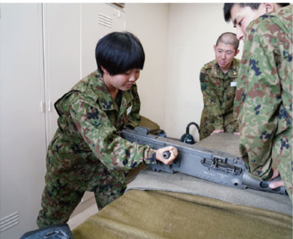
武器科後期教育（重機関銃整備）