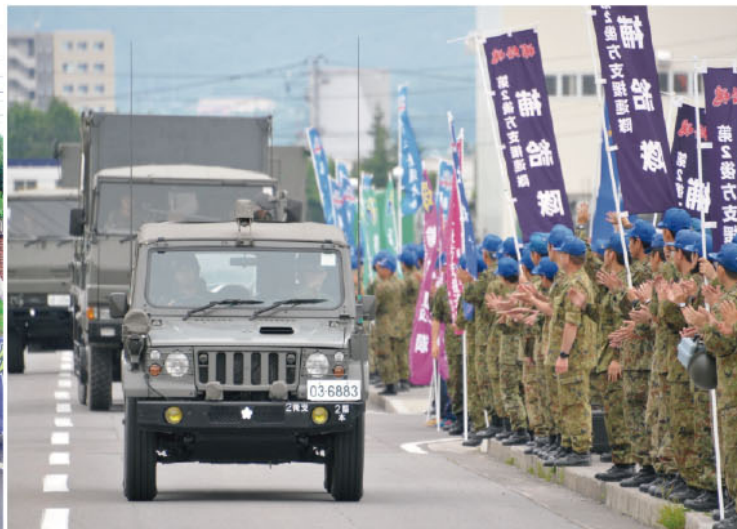
旭川駐屯地を出発する入浴及び給水支援隊(2D)