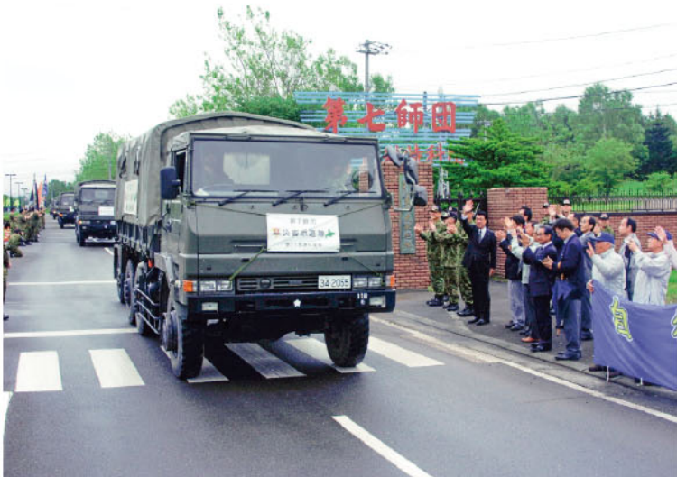
東千歳駐屯地を出発する入浴及び給水支援隊(7D)

田浦陸将(平)は平成30年7月豪雨に係る災害派遣のため7月9日、北部方面隊(総監)を率いて被災地へ派遣された。第2師団(2D)、第7旅団(7D)、第11旅団(11B)の北部方面隊後援隊として、第2師団(2D)の第7旅団(7D)と第11旅団(11B)の第5旅団(5B)の計3旅団、人員約360名、車両約125両が被災地へ派遣された。被災地では、給水支援隊として、給水ポンプを稼働させ、被災地に給水を行っている。また、入浴支援隊として、入浴施設を開設し、被災者に入浴の機会を提供している。被災者からは、支援隊の活動に感謝の言葉を述べ、今後の活動に協力する旨のメッセージが送られてきた。