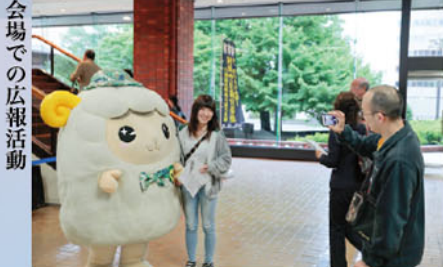
会場での広報活動