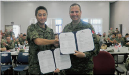
中間計画策定会議における合意

米国ハワイ州において中間計画策定会議 北部方面隊は、平成30年6月18日から26日の間、アメリカ合衆国ハワイ州のフォート・シャフトナーにおいて実施された平成30年度日米共同方面隊指揮所演習(YS-74)に参加した。日本側からは、日本陸上幕僚監部、陸上幕僚教育訓練研究所、米軍側から米太平洋軍司令部及び在日米陸軍司令部約10名が参加して行われ、構想策定会議(CDC)で設定した調整事項を日米で協議するとともに、共同作戦時における指揮幕僚活動を演練し、その能力の維持・向上を図った。 演習を通じて日米相互の親睦を更に深め、共同の対処能力を日米共同強化し、12月に実施される総合訓練(YS-75)の総合訓練(YS-75)に向けた準備を進めることができた。