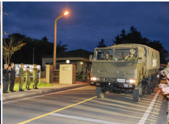
真駒内駐屯地を出発する入浴及び給水支援隊(11B)