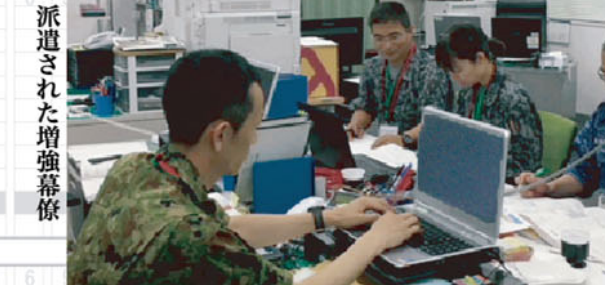
派遣された増強幕僚

北部方面隊は、平成30年6月19日から22日の間、平成一〇三年(30JXR)に参加した。総監部は、3X年1月19日H時、首都直下地震発災の想定の下、