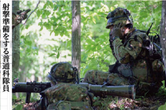
射撃準備をする普通科隊員