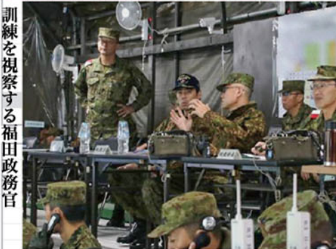
訓練を視察する福田政務官