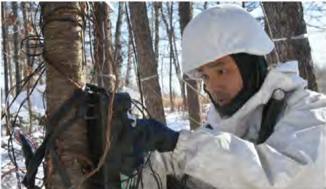
有線構成する隊員 (5通)