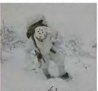
極寒の中での山地行進