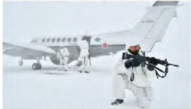
総監空輸訓練をする隊員 (北航隊)