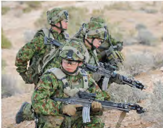
交戦装置を使用した対抗訓練

総合戦闘射撃は、1月28日から2月4日までの7日間、米陸軍との合同演習として実施された。訓練内容は、戦車戦闘団の戦術的行動能力を向上させることを目的として、米陸軍との合同演習を実施した。訓練内容は、戦車戦闘団の戦術的行動能力を向上させることを目的として、米陸軍との合同演習を実施した。