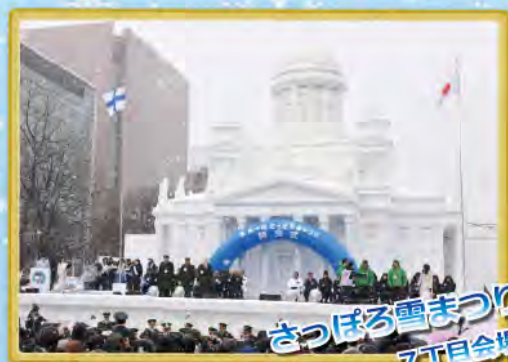
さっぽろ雪まつり 7丁目会場