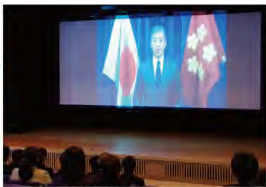
防衛大臣からの応援メッセージ