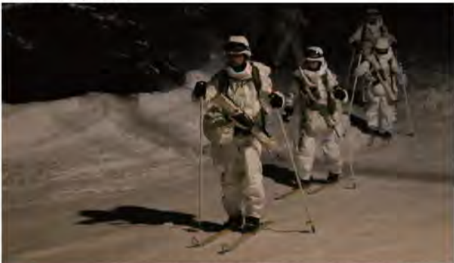
スキー行進する隊員 (3普連)