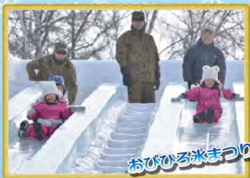
おびひろ氷まつり