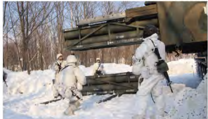
多連装ロケットシステムの射撃準備をする隊員 (131特科大)

北部方面隊は、積雪寒冷地である特性を踏まえ、積雪地教育訓練基準に基づき、各訓練、部隊訓練、訓練検閲を行い、部隊の戦闘力の向上を図っている。第11旅団においては、2月12日から3月1日までの間、北海道大演習場島松地区において、第18普通科連隊に対して冬季訓練の遊撃活動や航空攻撃の脅威下における攻撃の進行や、一連の行動 を検し、練度を評価した。併せて他の部隊に対して訓練の枠組みにおいて、他の師団、旅団及び直轄部隊において、冬季における市街地の戦闘力向上を図った。戦術、射撃、雪上での行進、偽装や野戦城、通信組織の構成、総監空輸などのそれぞれの部隊、職種の特長に応じた訓練を行い、積雪寒冷地における部隊と戦闘力の向上を図った。