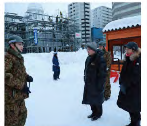
雪像制作を研修するオビニオンリーダー