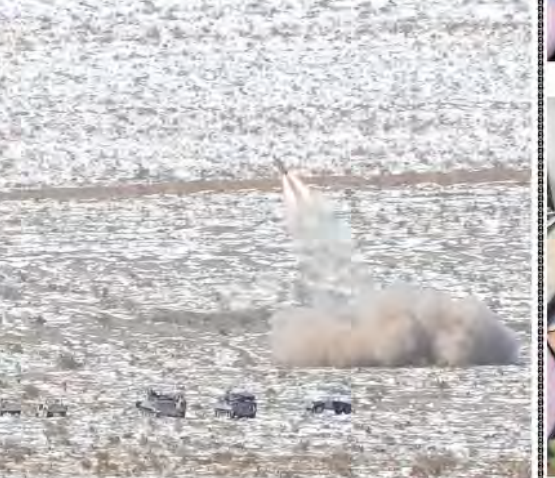
92式地雷原処理車による障害処理