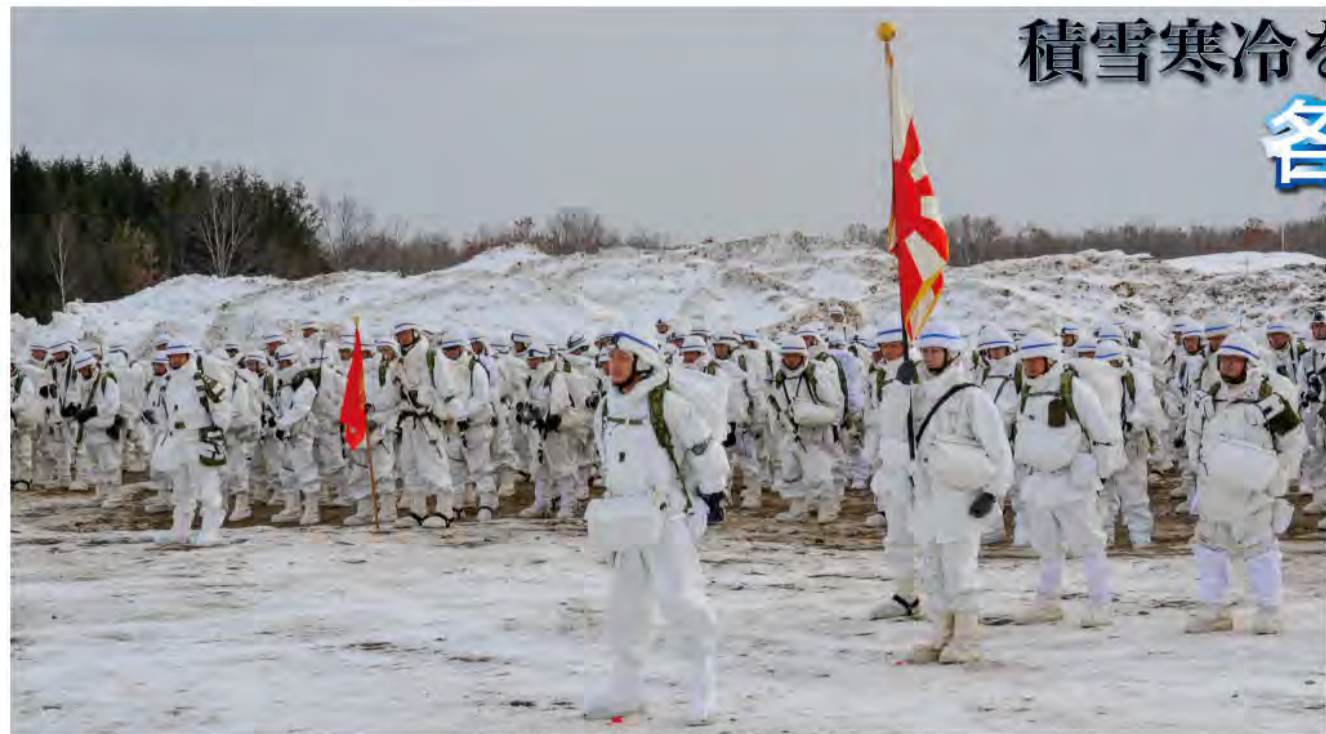
訓練検閲を受閲する部隊 (18普連)