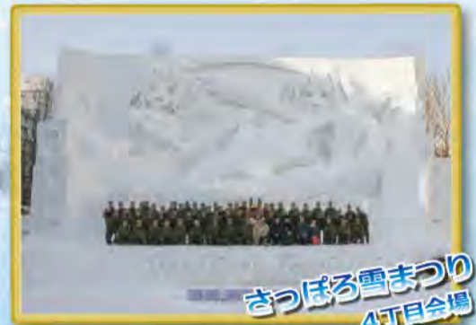
さっぽろ雪まつり 4丁目会場