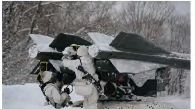
地对空誘導弾を設置する隊員 (1高団)