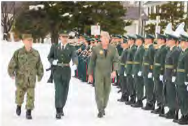
在日米海軍司令官来監