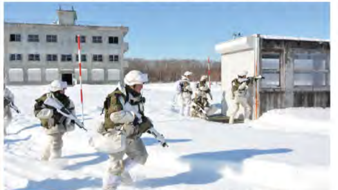
市街地において戦闘行動する隊員 (11普連)