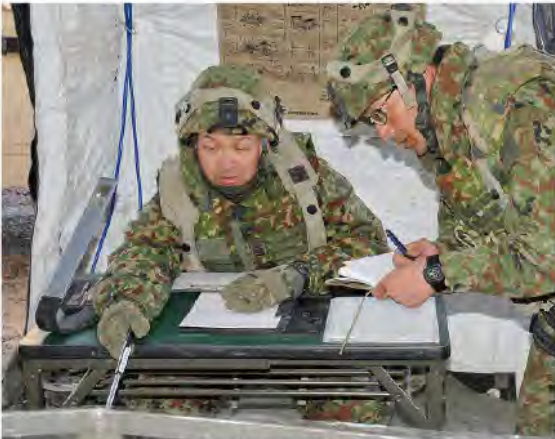
戦闘指導する戦闘団長