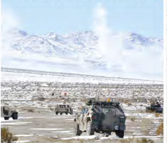
米軍との共同による阻止戦闘