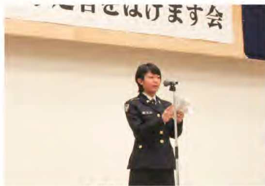
先輩隊員からの激励