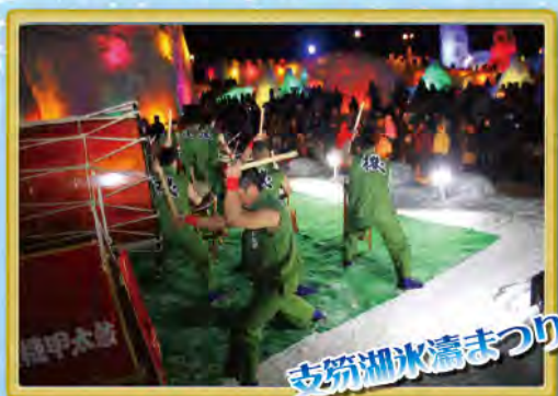
さっぽろ氷まつり