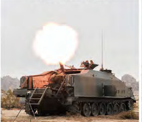
突撃支援射撃する96式自走120mm 迫撃砲