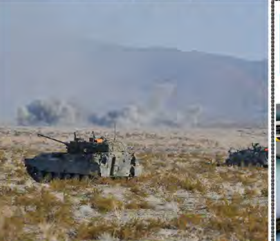
攻撃前進する89式装甲戦闘車