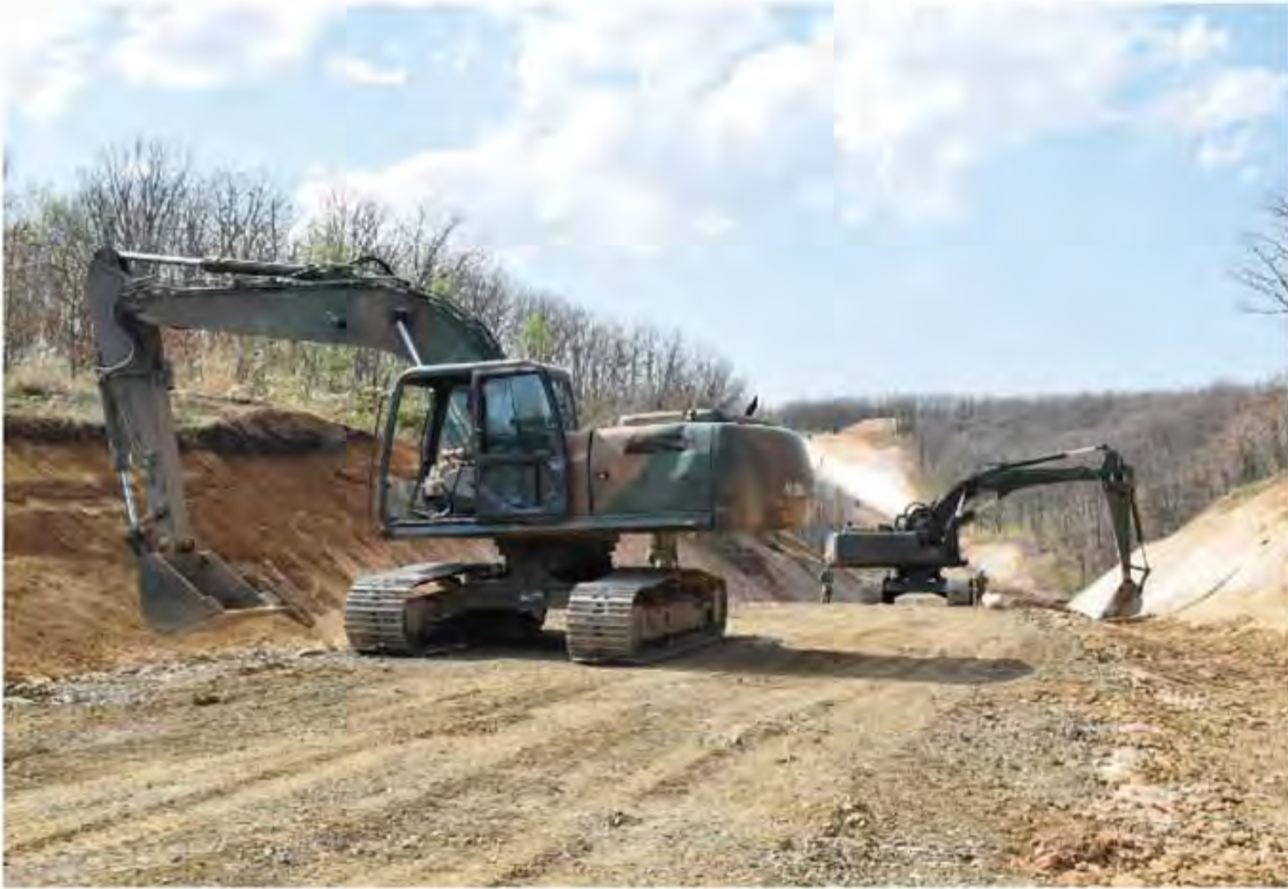
主要幹線道路の整備