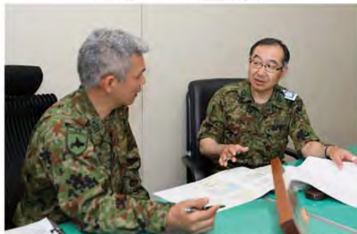
招集された1佐予備自衛官

北部方面隊は、5月21日から24日の間、令和元年度自衛隊統合防災演習(01JXR)に参加した。本演習は、東京オリンピック開催中に首都直下地震が発生したとの想定で実施され、防衛省・自衛隊、防災関係機関及び米軍が参加して行われた。總監部は、想定地震発生後、速やかに増強幕僚と連絡幹部を統合司令部(陸上総隊司令部)と東部方面隊司令部等へ派遣した。また、自衛隊統合防災演習として、