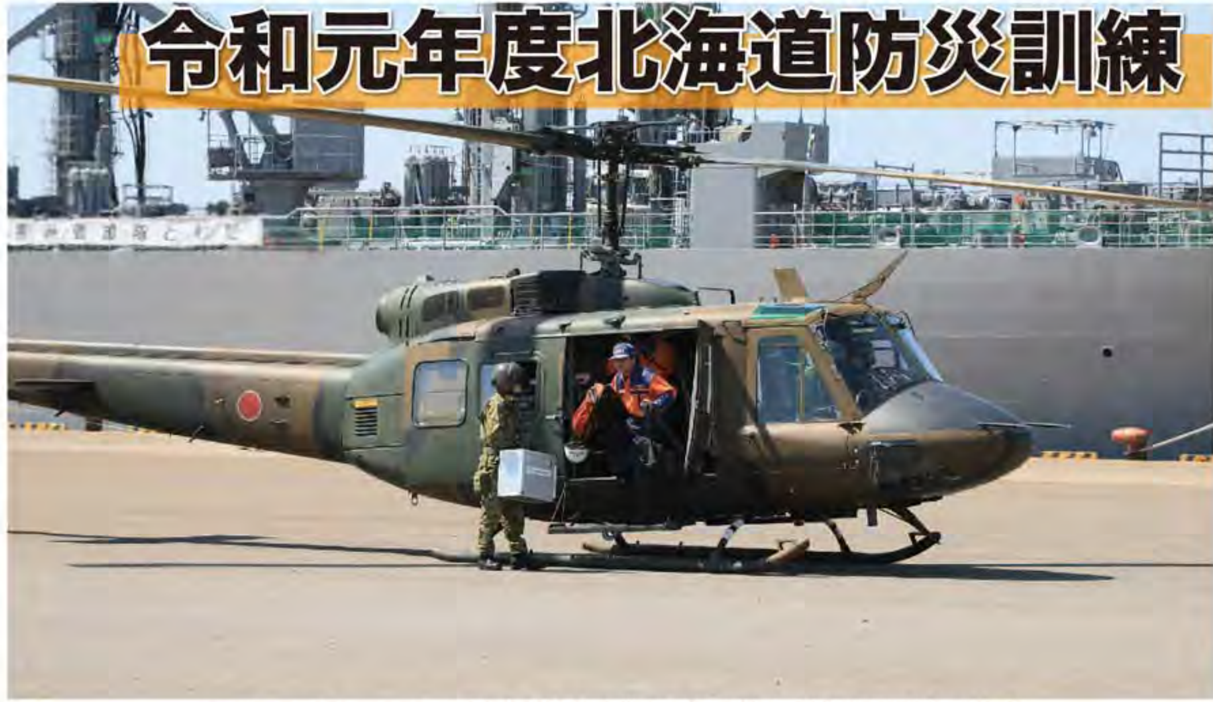
ヘリコプターによる総合通信局職員及び災害対策用器材の輸送

北部方面隊は、5月25日、令和元年度第1回北海道防災総本訓練には、第11旅団、方面航空隊及び方面通信群が参加し、物資輸送、給食・入浴支援、交通路確保及び映像伝送を実施した。 物資輸送では、海上自衛隊による海上輸送と連携して函館港からヘリコプター（UH-1）による空輸を実施した。また、北海道総合通信局との災害時における協定締結後初めて、総合通信局の職員や災害対策器材の輸送や支援を実施し、連携要援を確保した。 また、久根別川（北斗市）において機動支援橋による交通路確保を行ったほか、避難所において給食支援や入浴支援を実施した。 更に、映像伝送において、方面通信群によるヘリコプターからの映像伝送要領について演練した。 方面隊は、引き続き、北海道庁を始めとする関係機関との連携を強化するとともに、災害対処能力の向上を図るべく、更に、映像伝送要領について演練した。