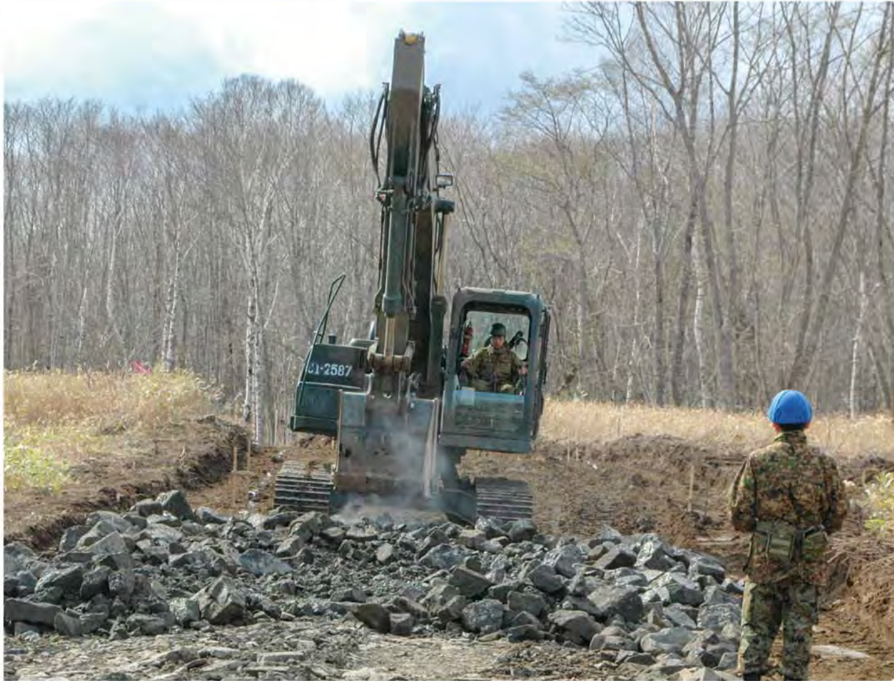
装軌車道新設工事

北部方面隊（総監 田浦陸将）は、5月8日から17日までの間、北海道大演習場、矢野演習場、上富良野演習場、鬼志別演習場及び然別演習場において北部方面隊演習場春季定期整備を実施した。 訓示において総監は、「方面隊の道場、ひいては陸上自衛隊の道場を整備する『道場化』は、陸上自衛隊のDNAの継承、自衛隊の実効的な抑止・対処能力の維持・向上のために極めて重要な任務である。各部隊は、『自らの道場は、自らが良くする。』という信念をもつて演習場整備に取り組み、道場化を推進せよ。」と訓示するとともに、「隊務の総合一体化、なかんずく最も強く、最も頼もしい部隊、健全な隊員の育成の場に活用された。」と訓示した。