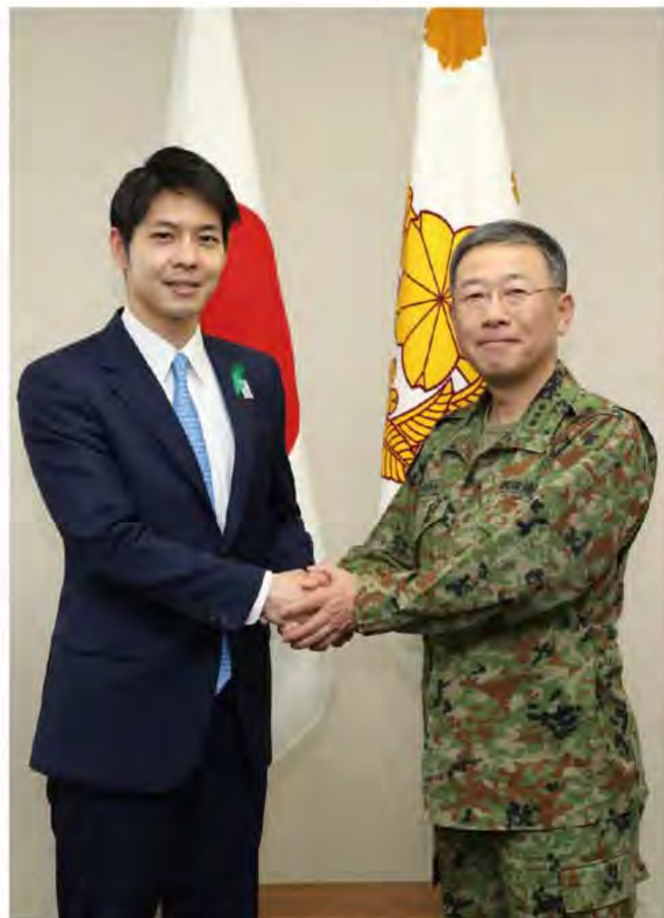
鈴木知事と握手を交わす総監

北部方面隊総監は、4月24日、北海道知事（鈴木直道氏）より、知事は、固い握手を交わすとともに、懇談において相互連携の重要性について再確認した。 方面隊は、今後も引き続き道と緊密に連携し、各種事態に迅速に対応できるように取り組んでいく。