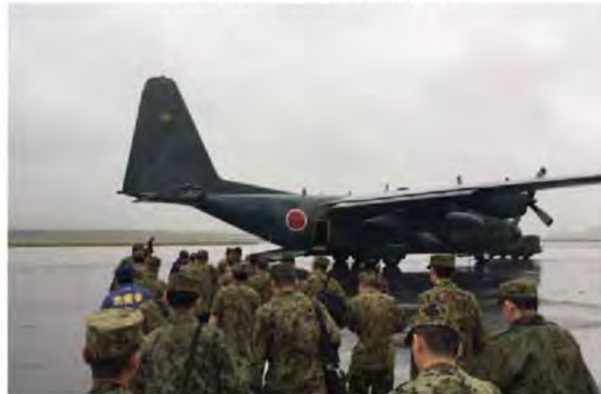
派遣された増強幕僚