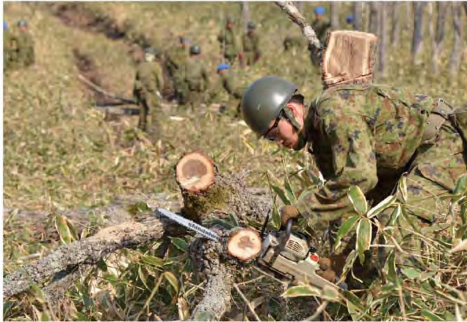
未活用地域の伐採

「安全管理及び健康管理の徹底」の3点を要望した。事業である本規模の主要演習場に展開し、装軌車道の新設や未活用地域の伐採と整備（充実整備）と射撃の整備といった演習場の整備と射撃の整備を最大限に活用する。また、各部隊は隊務の総合一体化と炊事及び勤務指導を行なう等、部隊・隊員の育成の場に活用された。」と訓示した。