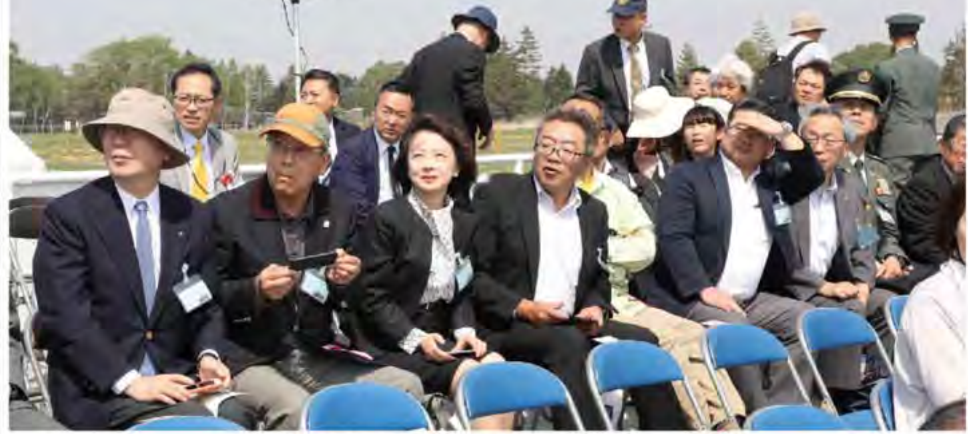
観閲式を研修するオピニオンリーダー

北部方面隊総監部は、5月26日、オピニオンリーダー活動として、東千歳駐屯地及び師団創隊64周年及び東千歳駐屯地創立65周年記念行事研修を行った。 本研修は、オピニオンリーダーを日本唯一の機甲師団である第7師団の創隊記念行事に招待し、方面隊の活動や第7師団の概要を理解し、当日は、快晴の中、戦車や装甲車などの車両380両、隊員約1300名による観閲式が行われた。