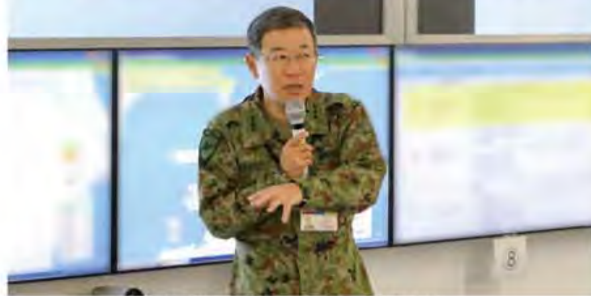
作戦会議での總監指導