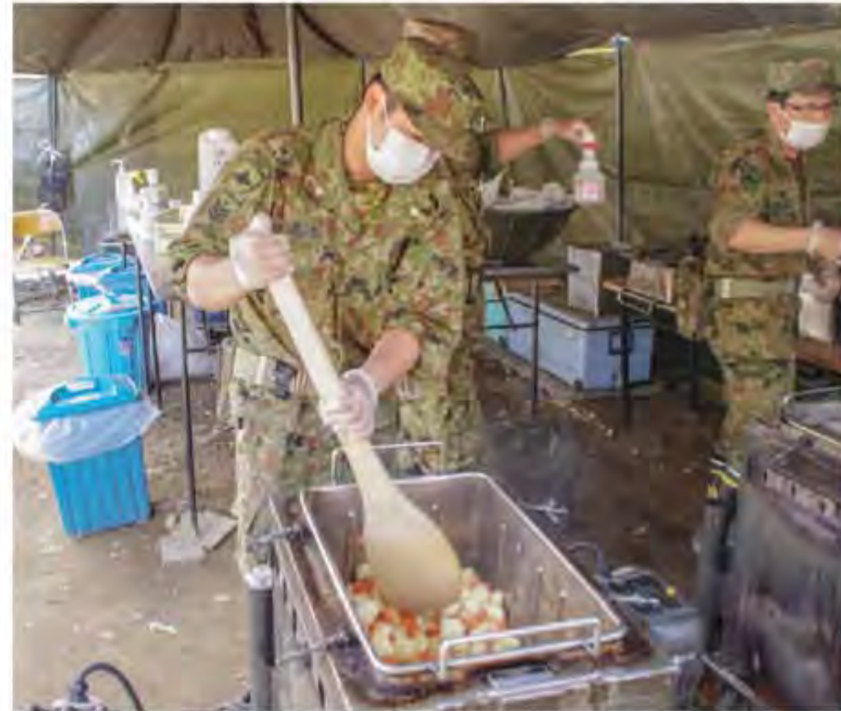
野外炊事（隊務の総合一体化）