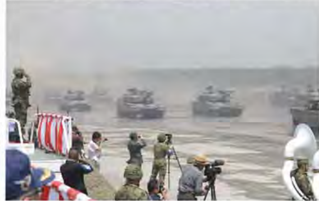
大迫力の観閲行進

北部方面隊総監部は、5月26日、オピニオンリーダー活動として、東千歳駐屯地及び師団創隊64周年及び東千歳駐屯地創立65周年記念行事研修を行った。 本研修は、オピニオンリーダーを日本唯一の機甲師団である第7師団の創隊記念行事に招待し、方面隊の活動や第7師団の概要を理解し、当日は、快晴の中、戦車や装甲車などの車両380両、隊員約1300名による観閲式が行われた。