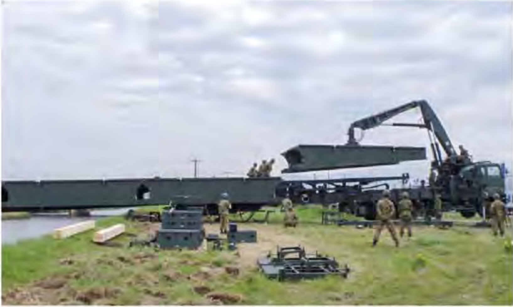
07式機動支援橋による交通路確保