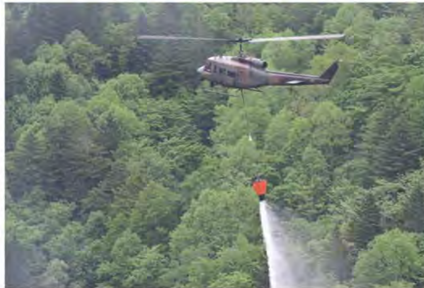
ヘリによる消火活動

北部方面隊は、雄武町上幌内地区において発生した林野火災に伴い、5月27日から6月4日までの間、災害派遣活動を広範囲に実施した。 が、道庁、道警、札幌市消防と連携し、1ヘリコプター及び1航空第2師団及び1航空第2師団の支援を受けた。6月4日、道知事から映像伝送を行った。方面隊は各種事態に対応するため、引き続き備えを万全に引き上げていく。