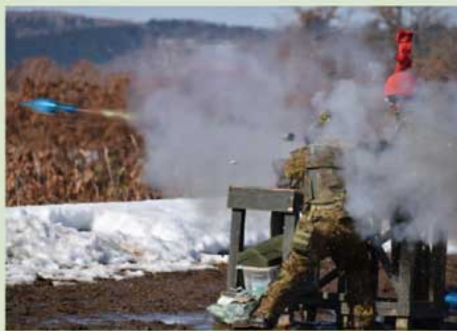
「発射!」 第25普通科連隊 増嶋2曹