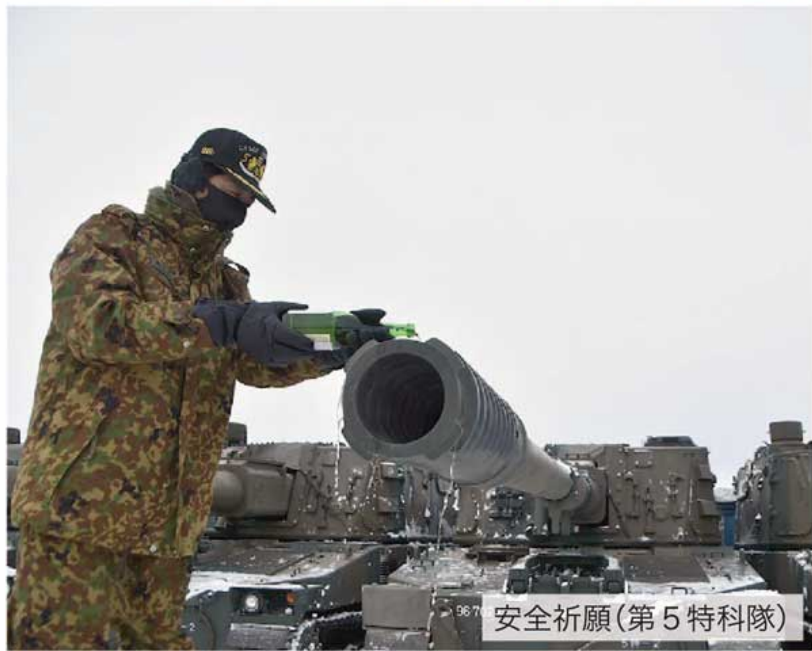
安全祈願(第5特科隊)

今年一年の飛躍や安全を祈願 新年を迎え、それぞれの駐屯地や部隊では、今年一年の飛躍や安全を誓い、訓練始めが行われた。 訓練始めに参加した隊員は、厳しい寒さの中、気持ちを新たに令和3年のスタートを切った。