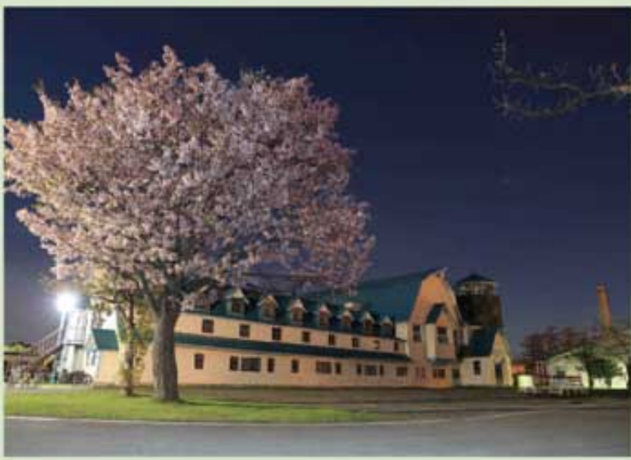
「サイロ隊舎の夜桜」 第11通信隊 矢瀬2曹