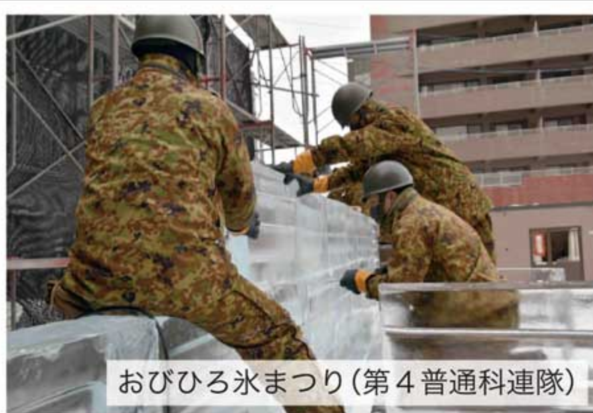
おびひろ氷まつり(第4普通科連隊)

各部隊は、道内各地で開催される冬季のイベント協力を実施している。隊員たちは、厳しい気象条件の中、新型コロナウイルス感染症防止に留意しつつ、昼夜を問わず雪像制作等に当たっている。