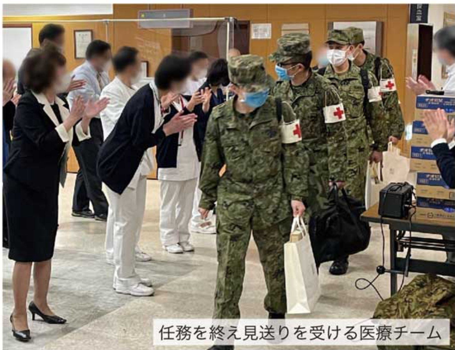
任務を終え見送りを受ける医療チーム