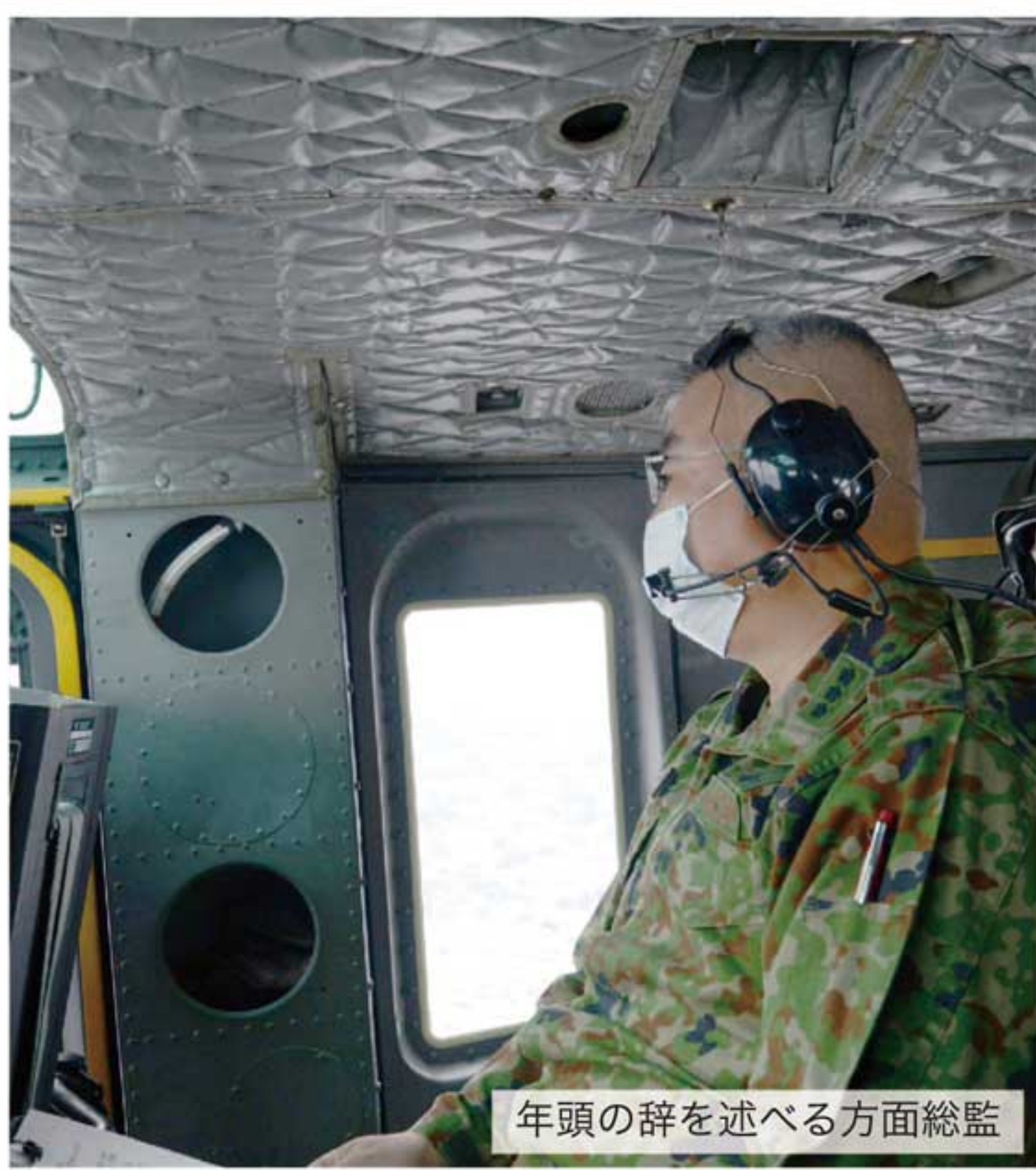
年頭の辞を述べる方面総監

この機会を活用し、総監として隊員諸君へ本年の隊務運営の着意を達する。これまでの要望事項『必成』に変わりはないものの、我々を取り巻く周辺情勢はもはや平時とは言い難いと認識している。かかる情勢下、北部方面隊は我が国最大・最強にして陸上自衛隊を牽引する方面隊として、本年は特に「軍事組織の原点に立ち返った隊務運営」に留意して欲しい。即ち、あらゆる隊務において、「真に戦えるか・勝利できるか」という視点をもつてこれに臨んでもらいたい。「治にいて乱を忘れず」とおり、各級指揮官、隊員一人ひとりに至るまで軍事組織の原点に立ち返った隊務運営を要望する。詳しくは改めて各指揮官を通じて達するが、本訓示をしっかりと咀嚼し、新しい年の隊務に当たってもらいたい。隊員諸君の更なる飛躍を祈念して、年頭の辞とする。