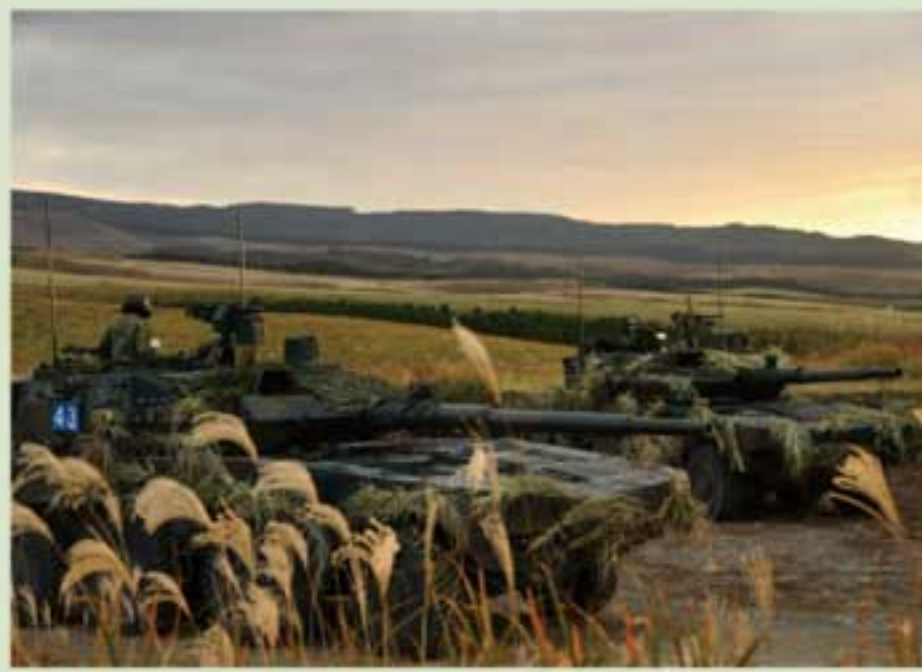
「揺れるもの、揺らがぬもの」 第2通信大隊 石川3曹