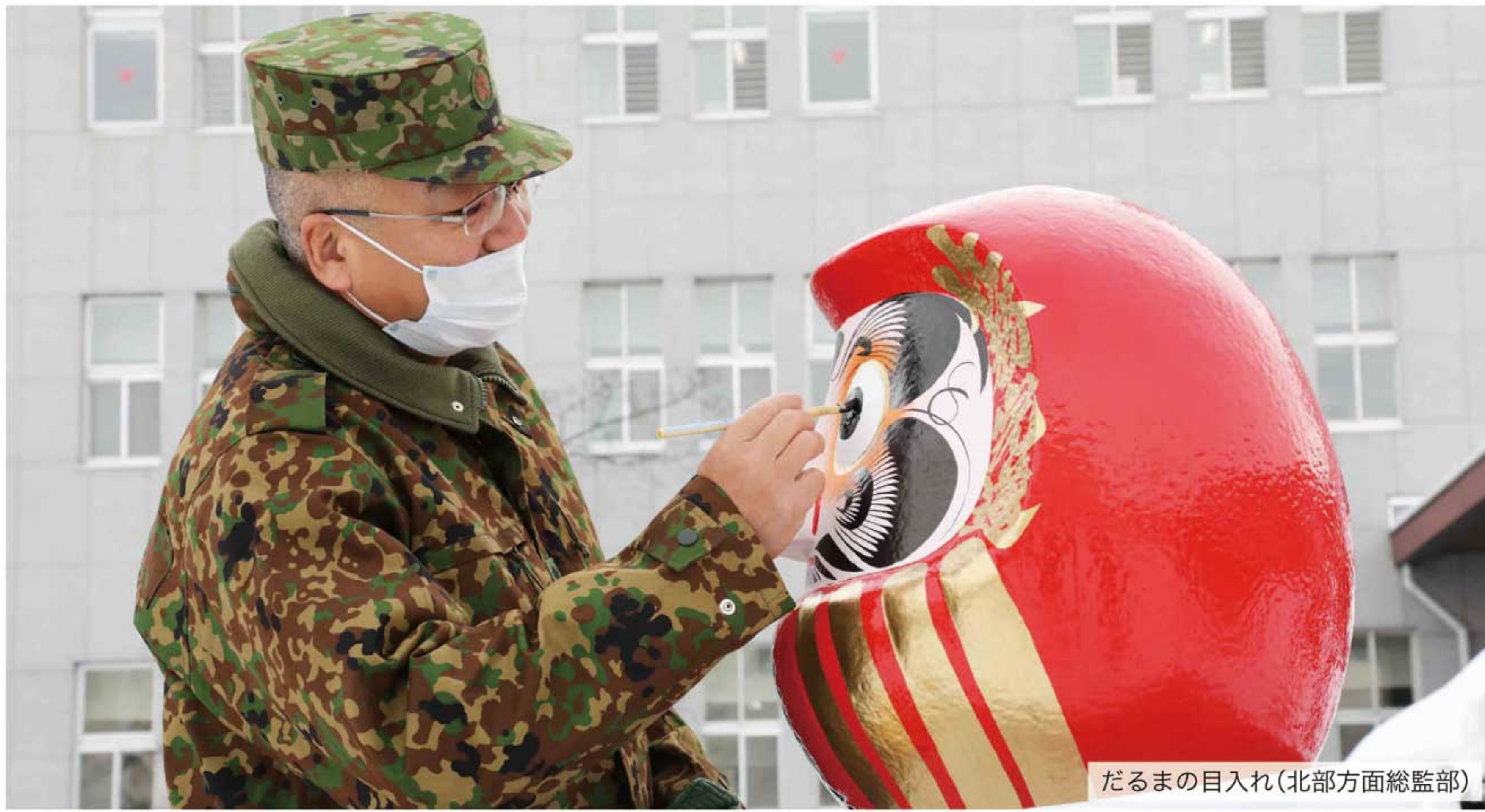
だるまの目入れ(北部方面総監部)

今年一年の飛躍や安全を祈願 新年を迎え、それぞれの駐屯地や部隊では、今年一年の飛躍や安全を誓い、訓練始めが行われた。 訓練始めに参加した隊員は、厳しい寒さの中、気持ちを新たに令和3年のスタートを切った。