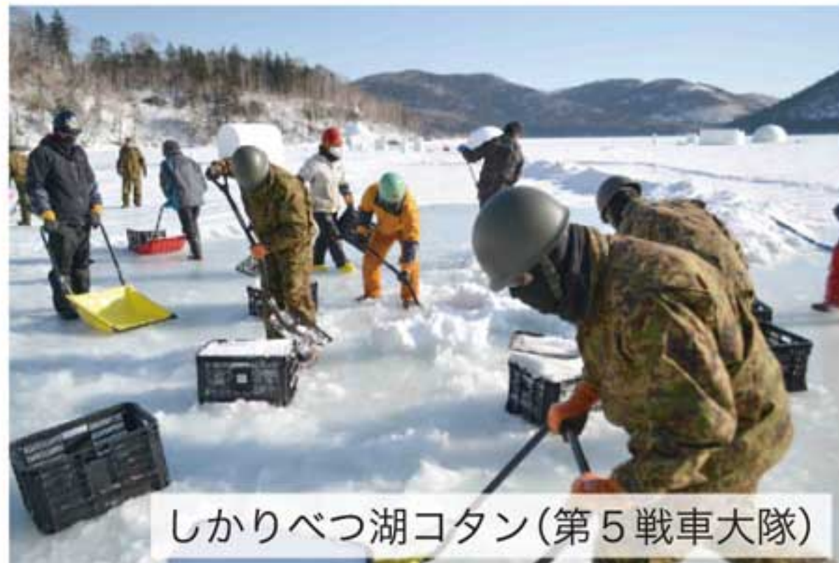
しかりべつ湖コタン(第5戦車大隊)