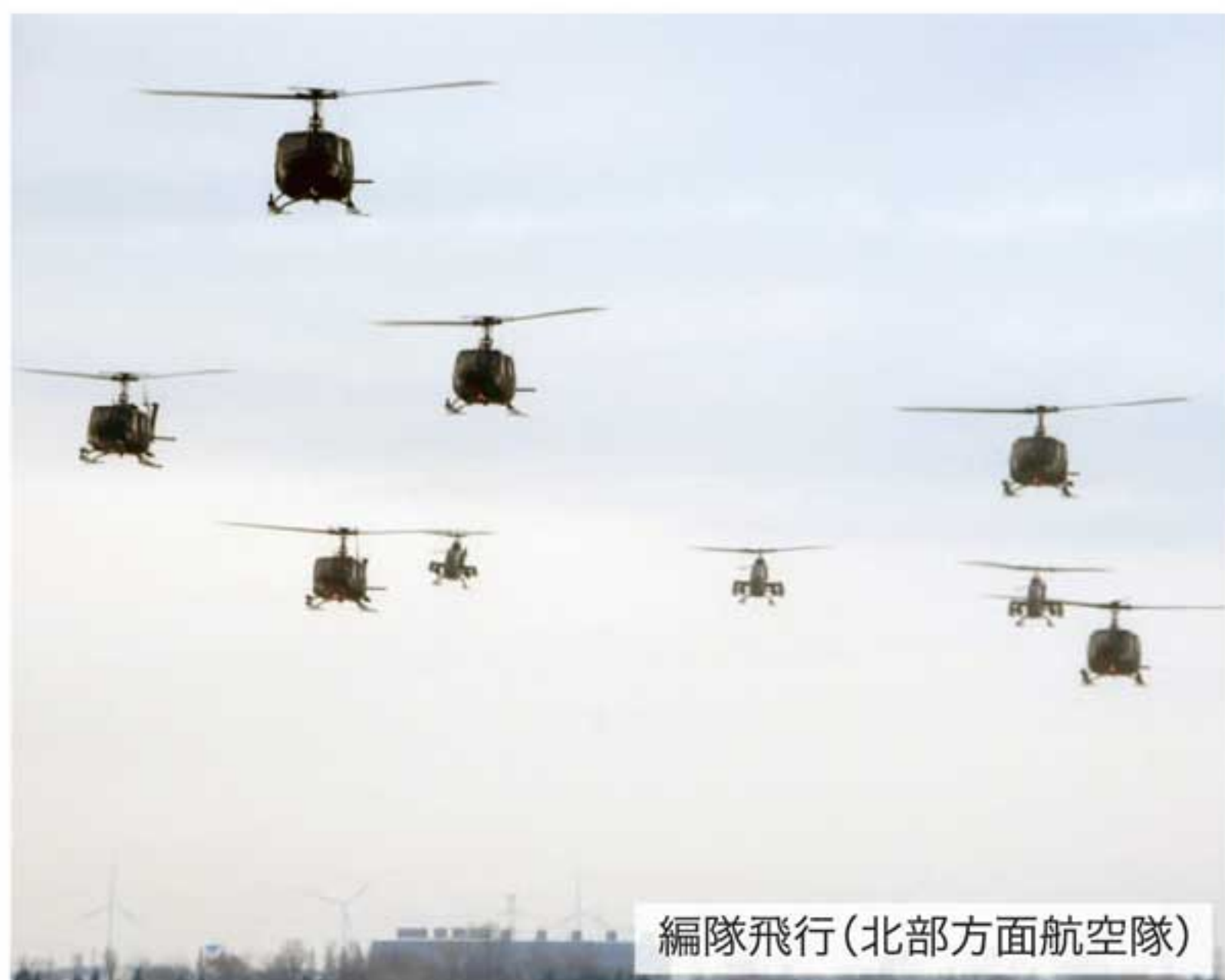
編隊飛行(北部方面航空隊)