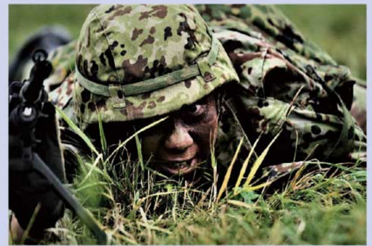
「前へ!!」 第10即応機動連隊 永武2曹