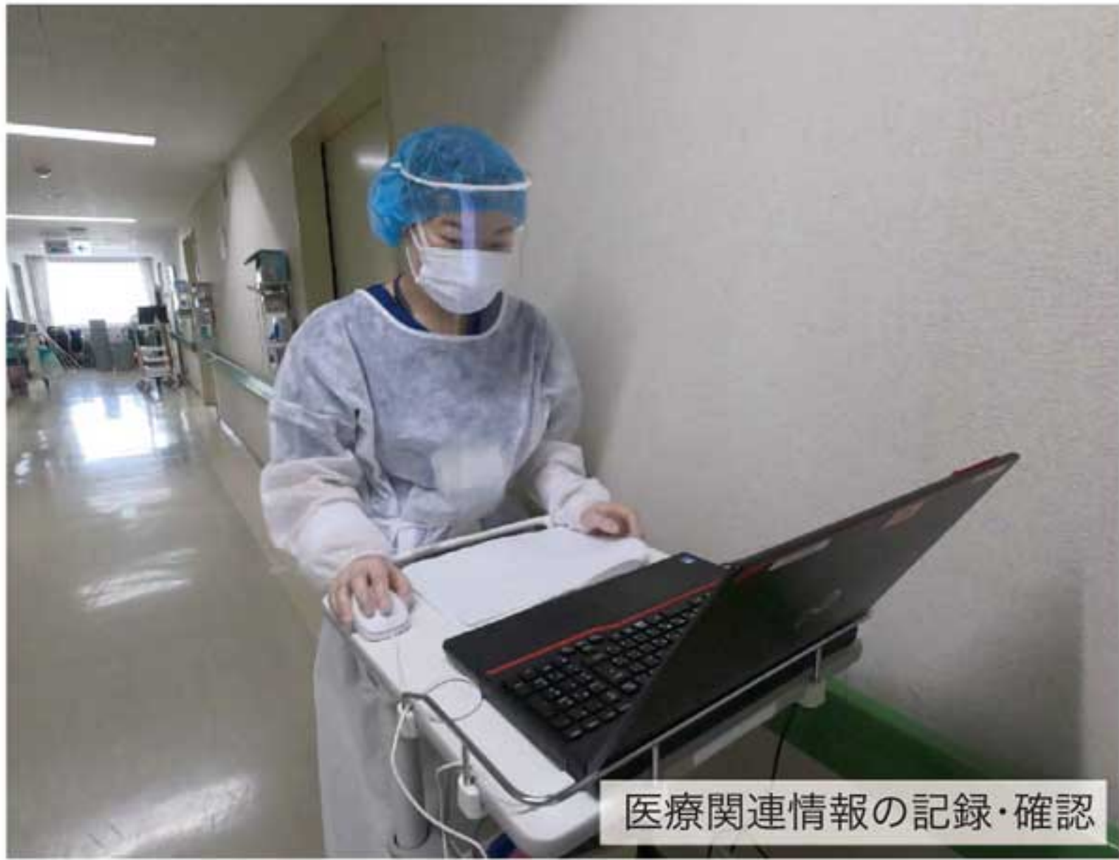
医療関連情報の記録・確認