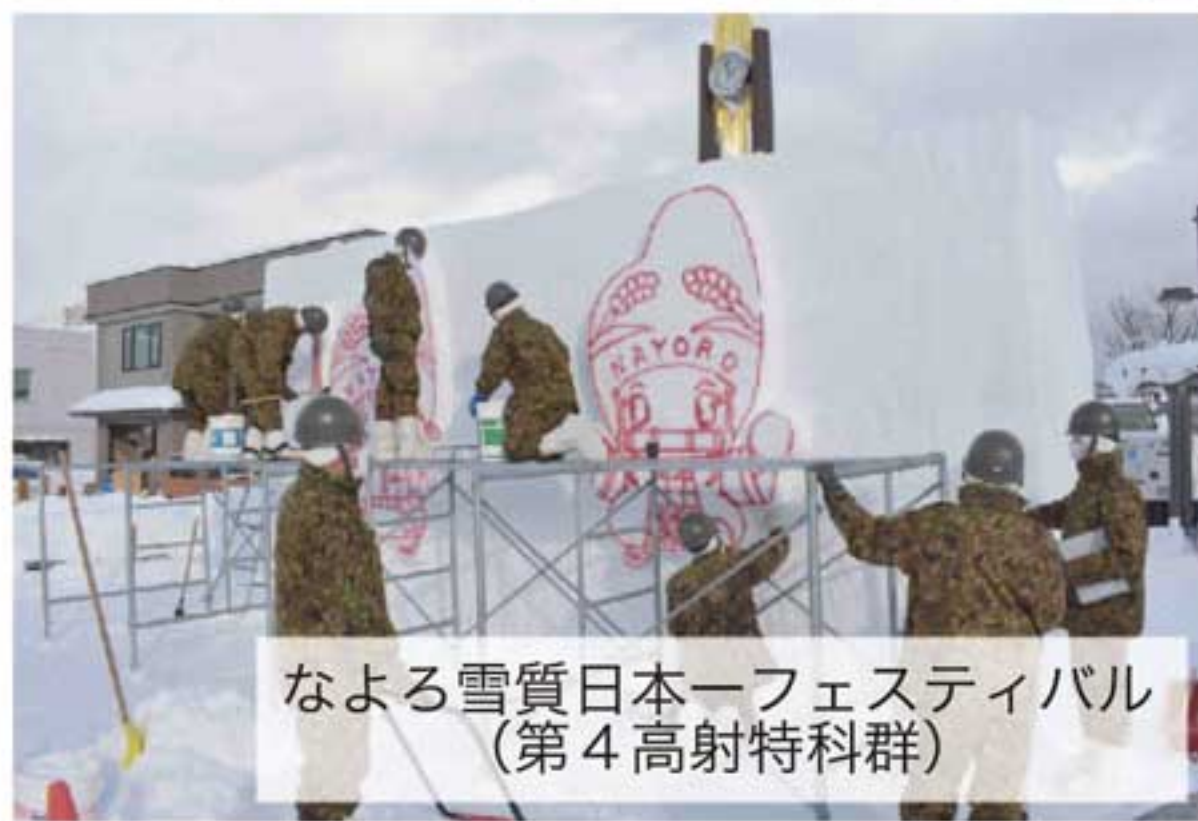
なよろ雪質日本一フェスティバル(第4高射特科群)

新型コロナウイルス感染症の終息が見通せない中、各地のイベントは中止や縮小を余儀なくされているが、各部隊は変わることなく、イベント協力を実施して、地域の皆様に笑顔と感動をお届けしていく。