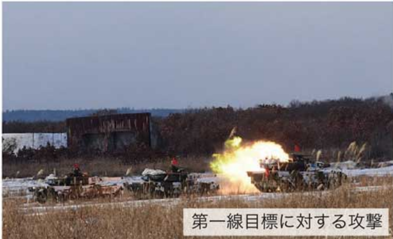
第一線目標に対する攻撃

演練した。各戦車戦闘団は、実戦的かつ実際の状況において、諸職種が協同し、各級指揮官の適切な状況判断と指揮の下、戦況に応じた火力の組織化を図り、総合戦闘力を最大限発揮し、それぞれの任務を完遂した。