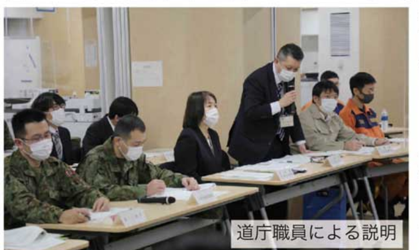
道庁職員による説明

方面隊は、1月14日、開発局、北海道警察本部北海道庁において実施された災害対処指揮所訓練勉強会に参加した。 本勉強会では、ICERを活用した被害状況の把握・共有を図るとともに、方面隊と道、各関係機関等との間で、道央地域(札幌地区)大震災対応に係る関係把握・共有を図るとともに、災害対処計画の見直しに反映域(札幌地区)大震災対応に係る救出・救助(要救助者の把握、部隊活動総監部、第11旅団、第3及及び情報共有要領)、交通急対策(道路啓開)に空隊が参加したほか、北海道庁、札幌市、北海道ヘリコプター等の活用