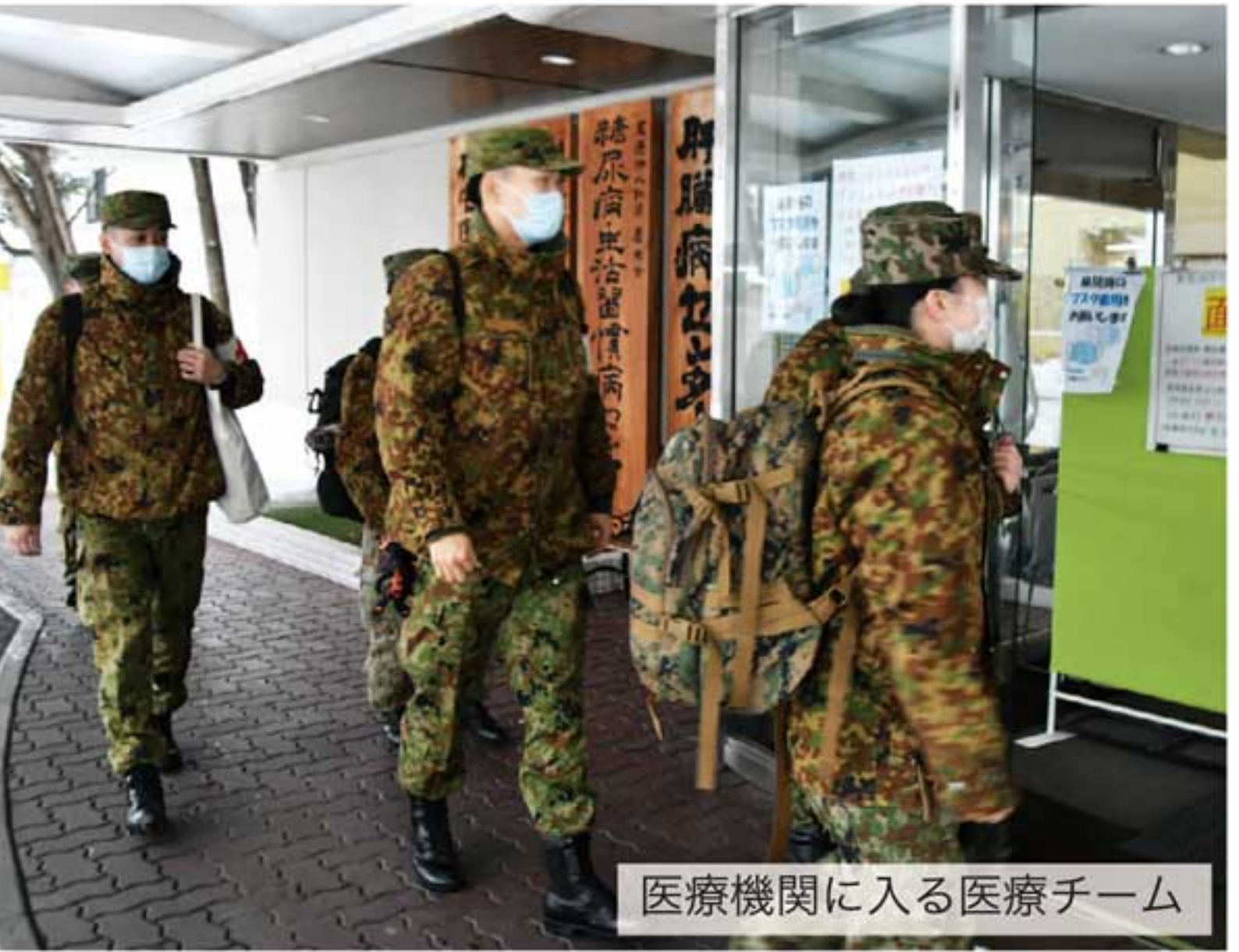
医療機関に入る医療チーム