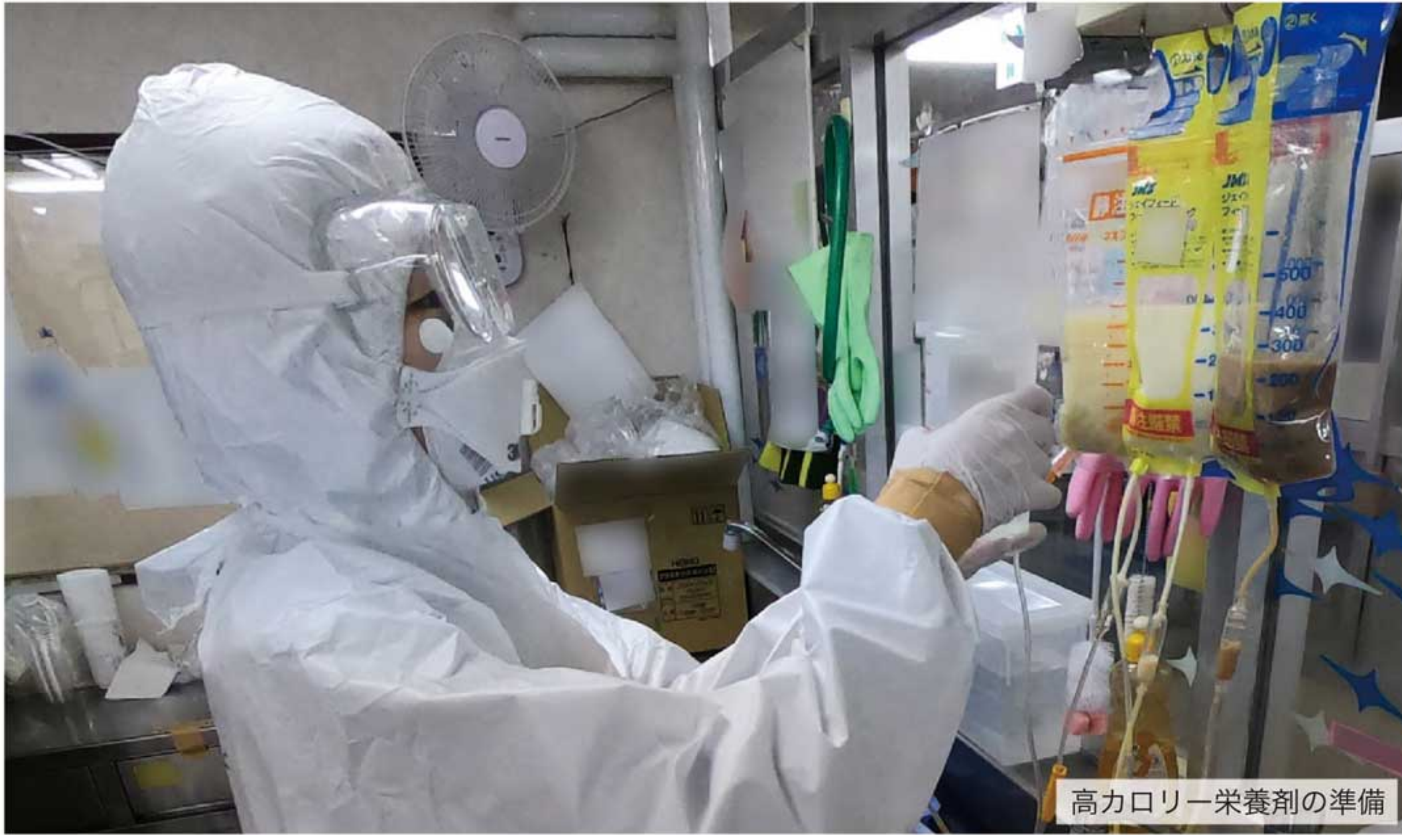
高カロリー栄養剤の準備