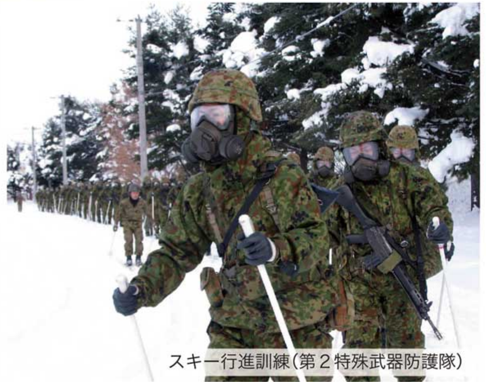
スキー行進訓練(第2特殊武器防護隊)