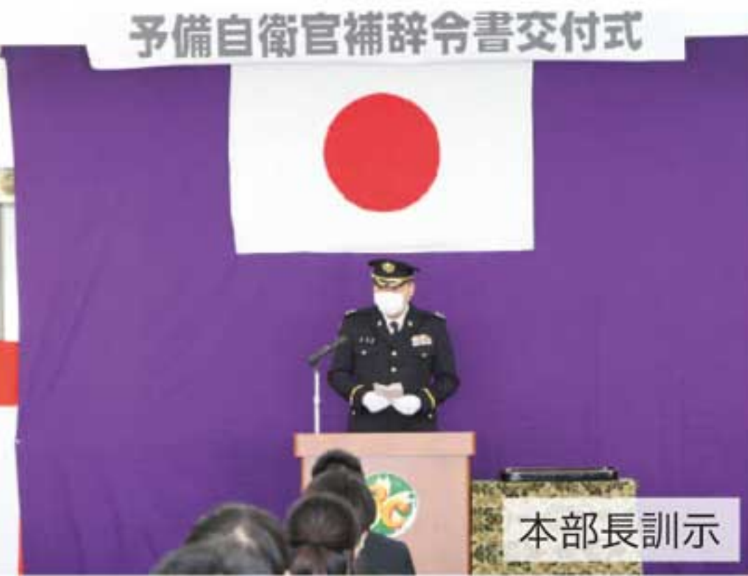
予備自衛官補辞令書交付式