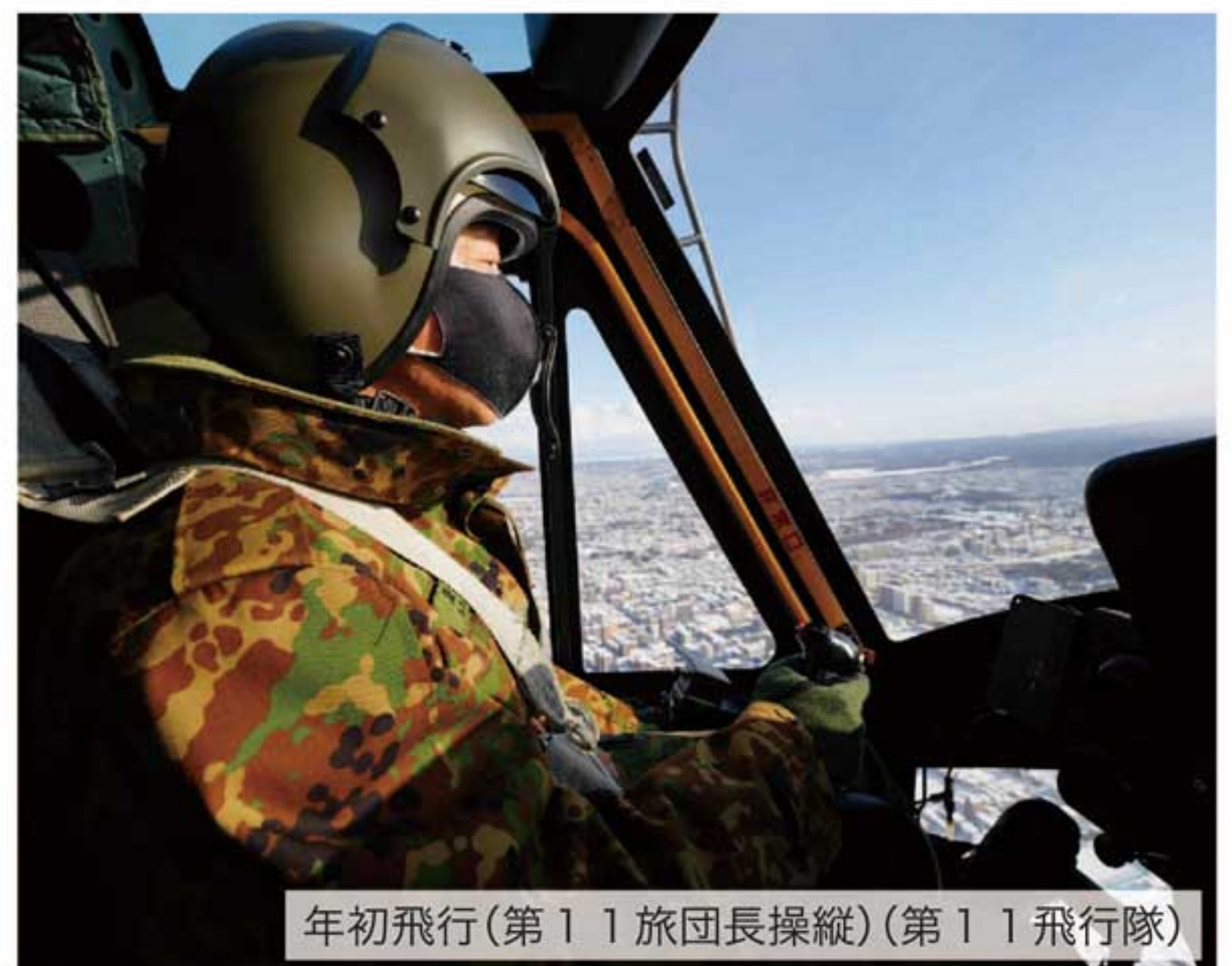
年初飛行(第11旅団長操縦)(第11飛行隊)