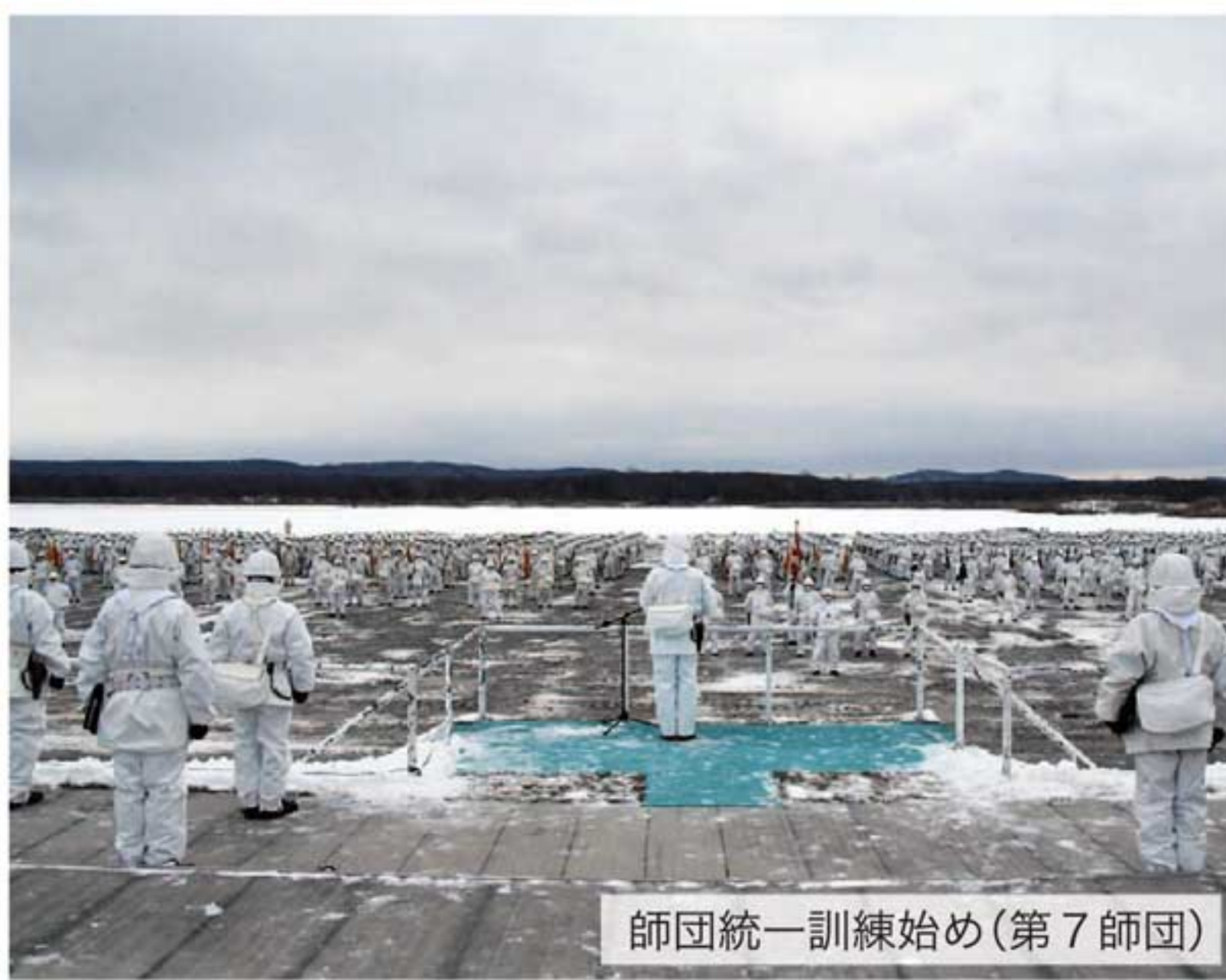
師団統一訓練始め(第7師団)