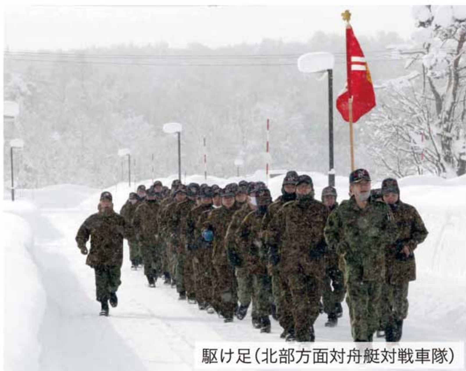
駆け足(北部方面対舟艇対戦車隊)