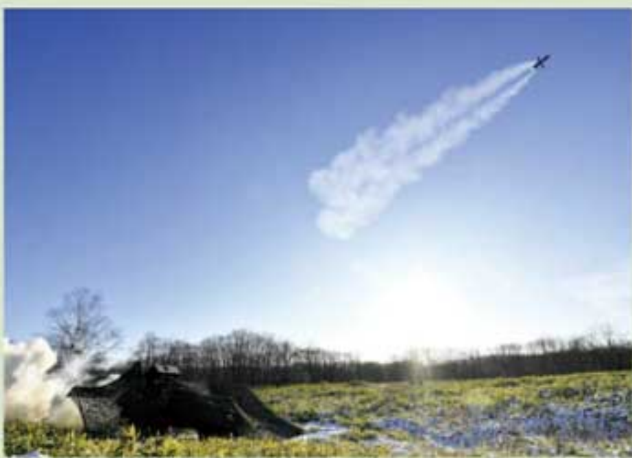
「空高く」 第2通信大隊 市場2曹