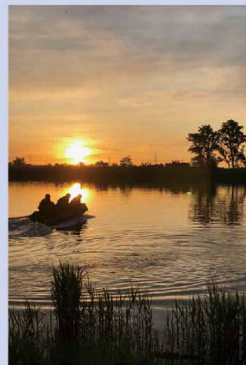
「日没の向こう」 第11偵察隊 中前園2曹