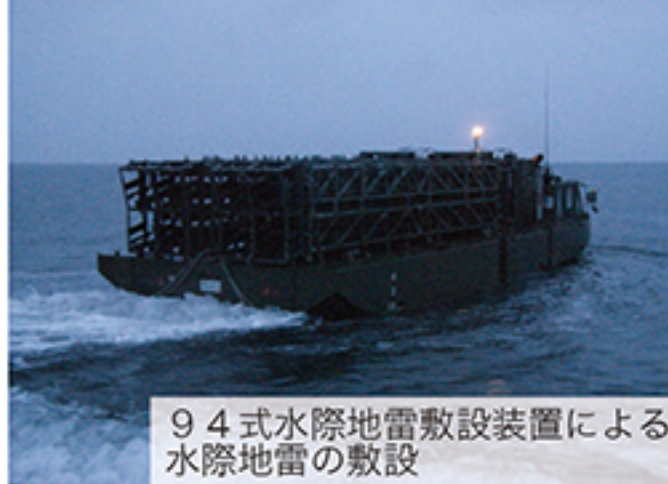
94式水際地雷敷設装置による水際地雷の敷設