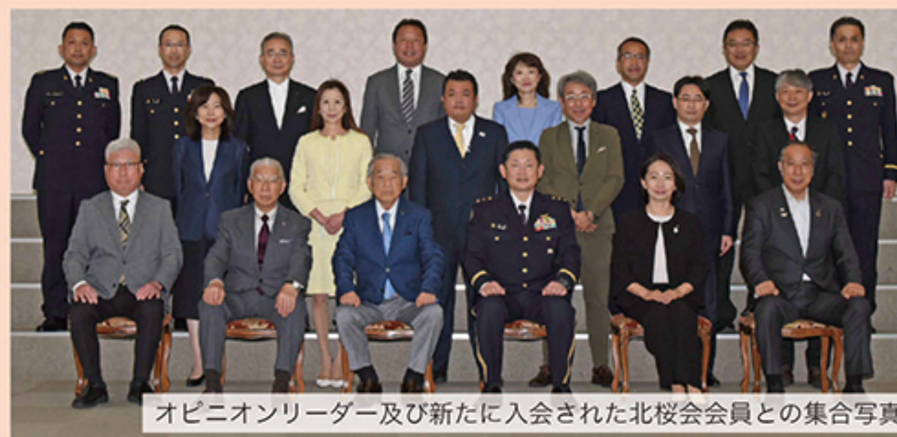
オピニオンリーダー及び新たに入会された北校友会会員との集合写真