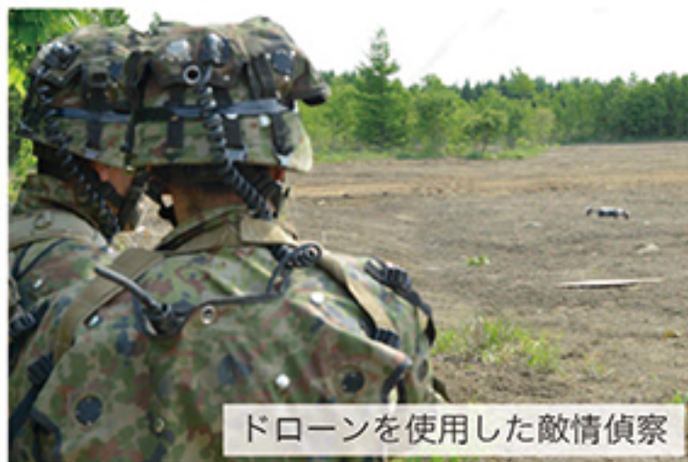
ドローンを使用した敵情偵察

北部方面隊は、6月2日から21日までの間、北海道大演習場恵庭・千歳地区において、機械化部隊戦闘訓練評価支援センター方式による訓練(ACCITESC)を実施した。