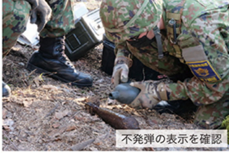
不発弾の表示を確認

北部方面隊は、道内各地域において警察・自治体・住民等からの連絡により発見された部外における不発弾を回収・処理している。 不発弾は、令和4年度に入り7月まで、それぞれの師・旅団の管内で第2後方支援連隊が6件、第7後方支援連隊が3件、第5後方支援連隊が3件、第11後方支援連隊が8件の処理を実施した。 方面隊は、引き続き、地域社会及び道民の安心・安全な暮らしを守るため活動していく。