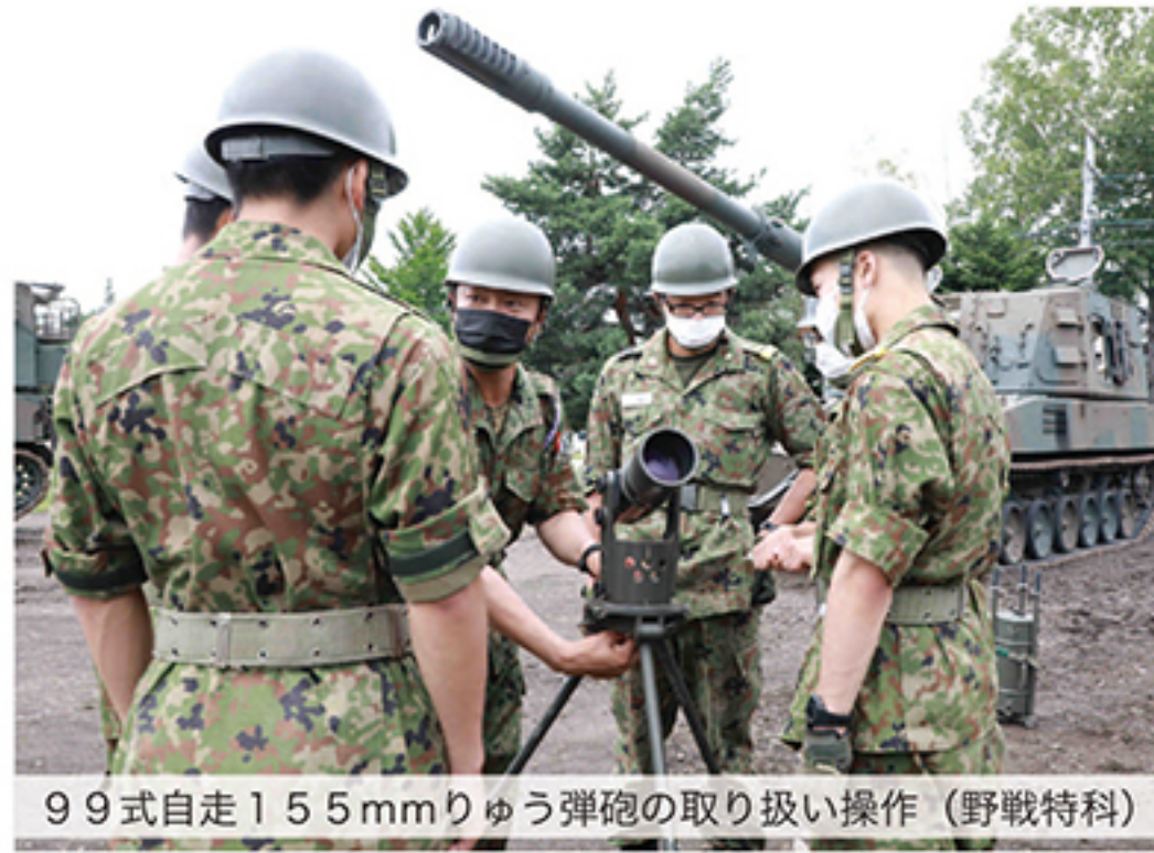
99式自走155mmりゅう弾砲の取り扱い操作（野戦特科）