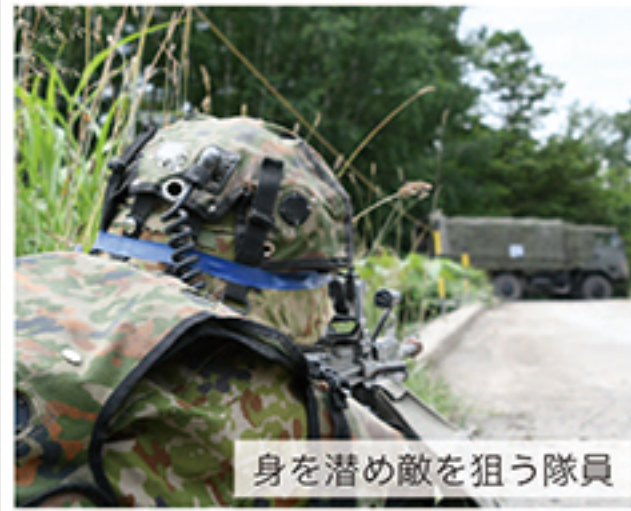
身を潜め敵を狙う隊員