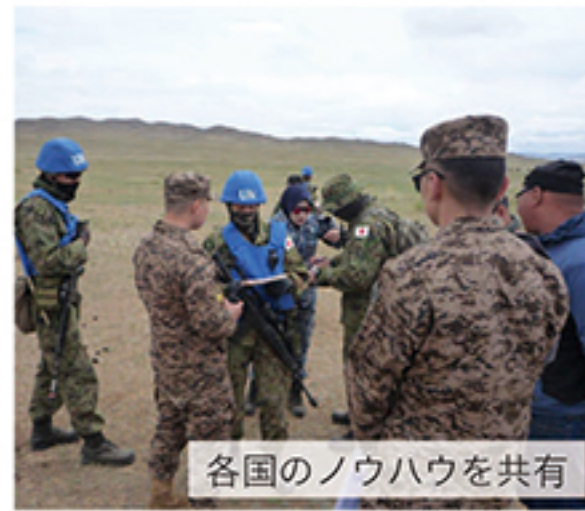
各国のノウハウを共有