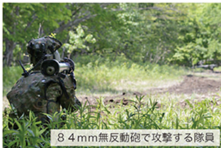
84mm無反動砲で攻撃する隊員