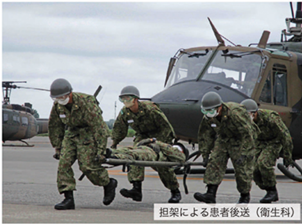
担架による患者後送（衛生科）