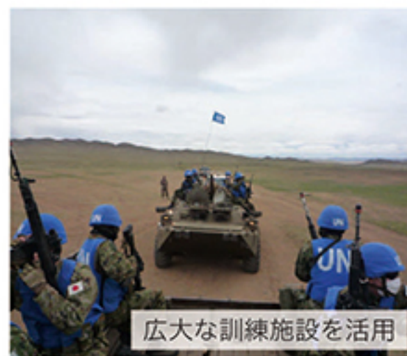
広大な訓練施設を活用

北部方面隊は、6月6日から6月20日までの間、モンゴル国ファイブヒルズ訓練場等において令和4年度多国間訓練(カーン・クエスト22)に参加した。本訓練には、陸上総隊直轄部隊とともに、第11旅団隷下の第18普通科連隊基幹の隊員が参加し、モンゴル国、米国をはじめとする16か国とともに、国連平和維持活動等への派遣に資する各種能力の維持、ノウハウの獲得、相互理解の促進及び信頼関係の強化を図った。 本訓練に小隊長として参加した隊員からは、「PKO等の海外派遣に備えるべき知識・技能の向上を図ることができた」とともに、他国軍との交流は貴重な経験であった。この所見を得るとともに、初めて国外における訓練に参加した隊員からは、「言語や文化の違いがある中で、訓練は、とてもいい経験になった。」との所見を得た。