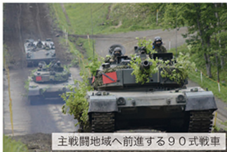
主戦闘地域へ前進する90式戦車