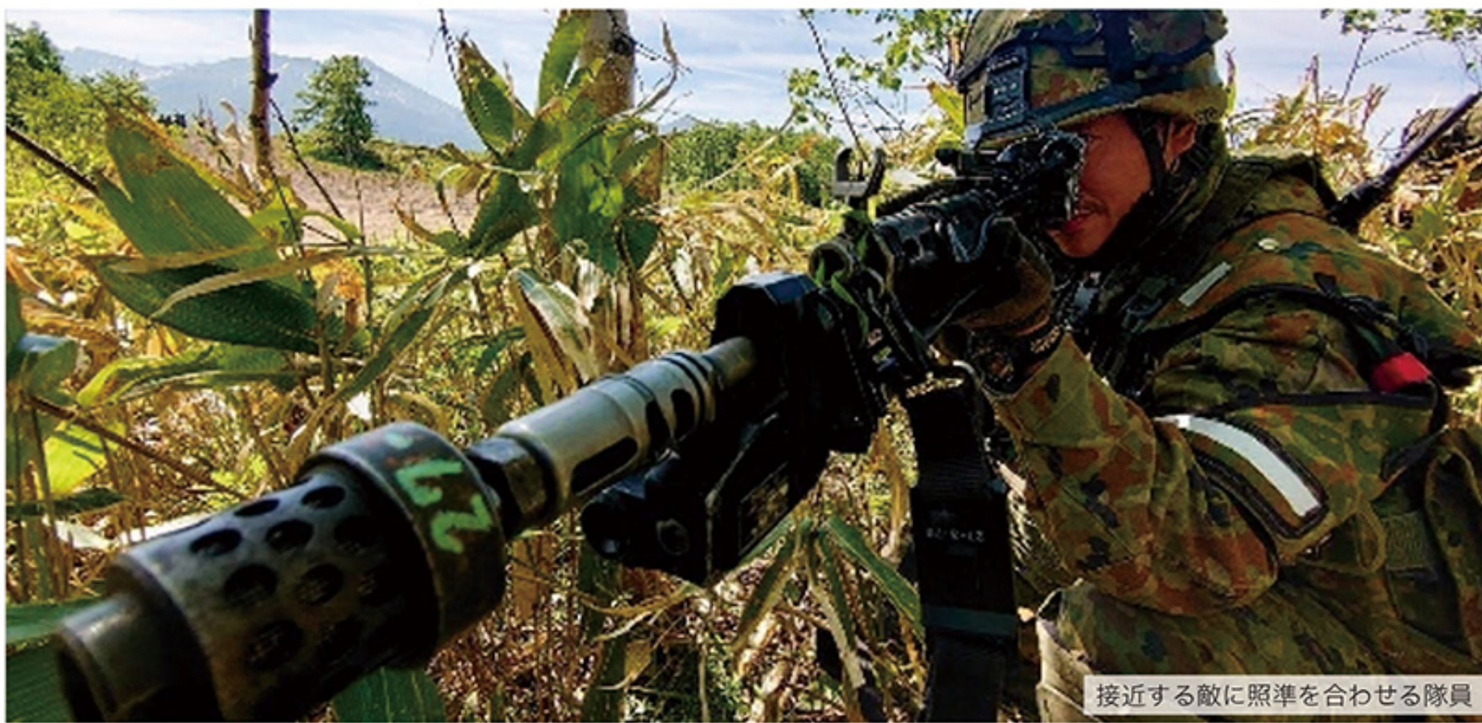
接近する敵に照準を合わせる隊員

北部方面隊は、5月27日から6月10日までの間、上富良野演習場において、陸上自衛隊教育訓練研究本部が担任する、令和4年度北海道訓練第4普通科連隊(帯広)