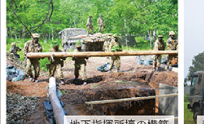
地下指揮所壕の構築