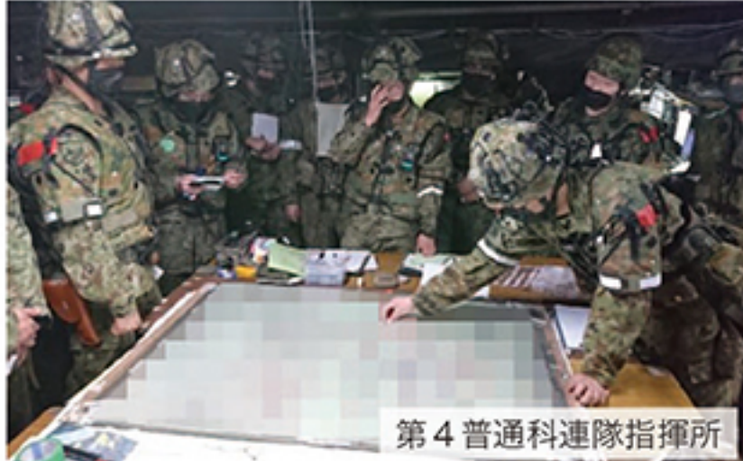
第4普通科連隊指揮所