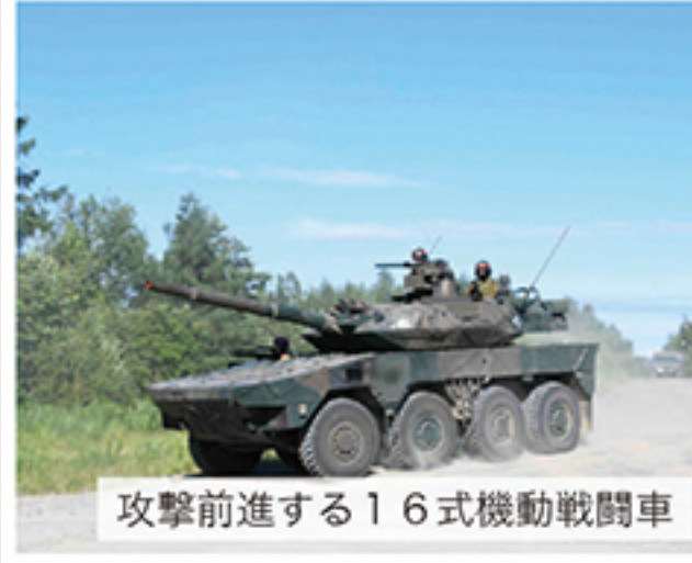
攻撃前進する16式機動戦闘車