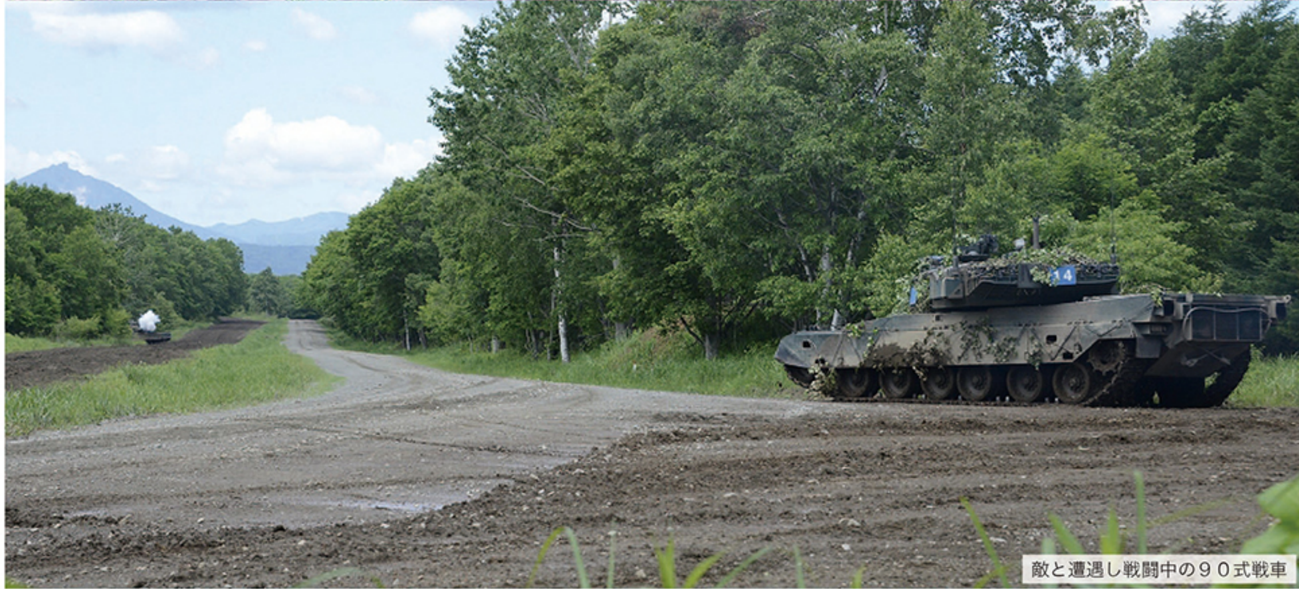
敵と遭遇し戦闘中の90式戦車