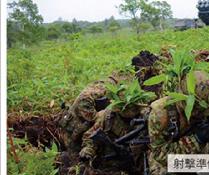
射撃準備を完了した射撃班と発射機

第1特科団(団長 牧野陸将補)は、6月30日から7月14日の間に、令和4年度第1地对艦ミサイル連隊及び第3地对艦ミサイル連隊訓練検閲を、それぞれ実施した。 本訓練検閲においては、離島侵攻対処における師団・旅団に配属された地对艦ミサイル連隊の行動を検閲課題とし、その訓練練度を評価・判定した。 この際、海・空自衛隊及び陸上自衛隊のレーダ、監視哨等の情報収集部隊が収集した目標情報に基づき、地对艦ミサイルによる対艦戦闘を実施した。 本訓練検閲を通じ、対艦戦闘能力の即応性・実効性の向上について、更なる練度向上を図った。