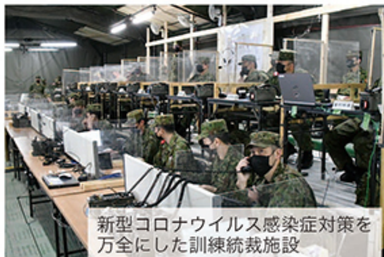
新型コロナウイルス感染症対策を万全にした訓練統裁施設