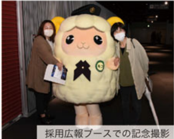
採用広報ブースでの記念撮影

今回初めて来場した高校生からは、「心に刺さった」等の感想をいただいた。 今後、方面音楽まつりを10月14日に札幌文化芸術劇場hitaru(ヒタル)で、第91回定期演奏会を来年2月3日に札幌コンサートホール kitara(キタラ)で予定している。