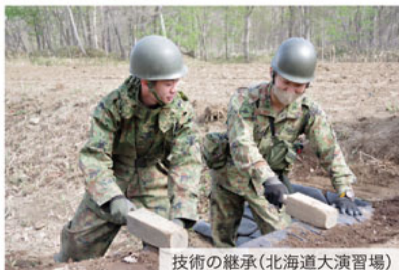
技術の継承(北海道大演習場)