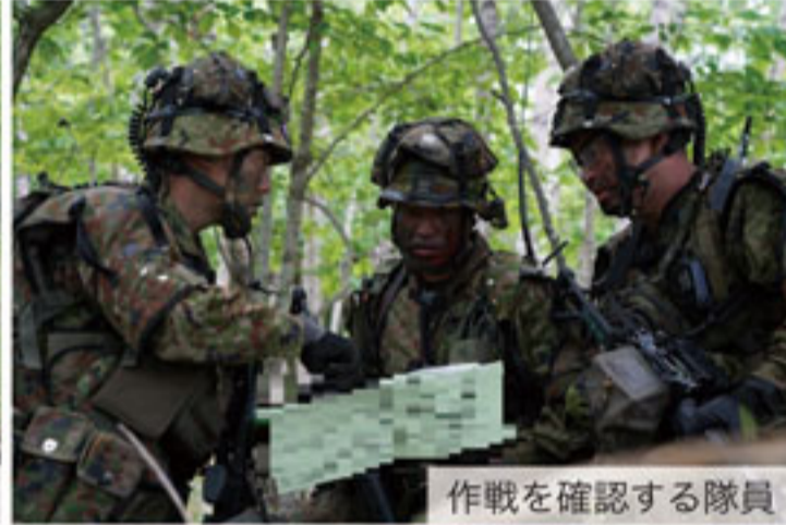
作戦を確認する隊員