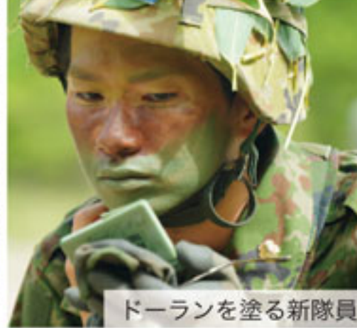
ドーランを塗る新隊員