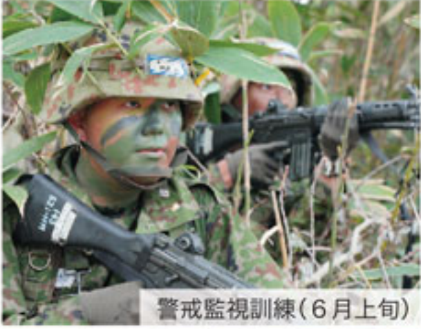
警戒監視訓練(6月上旬)