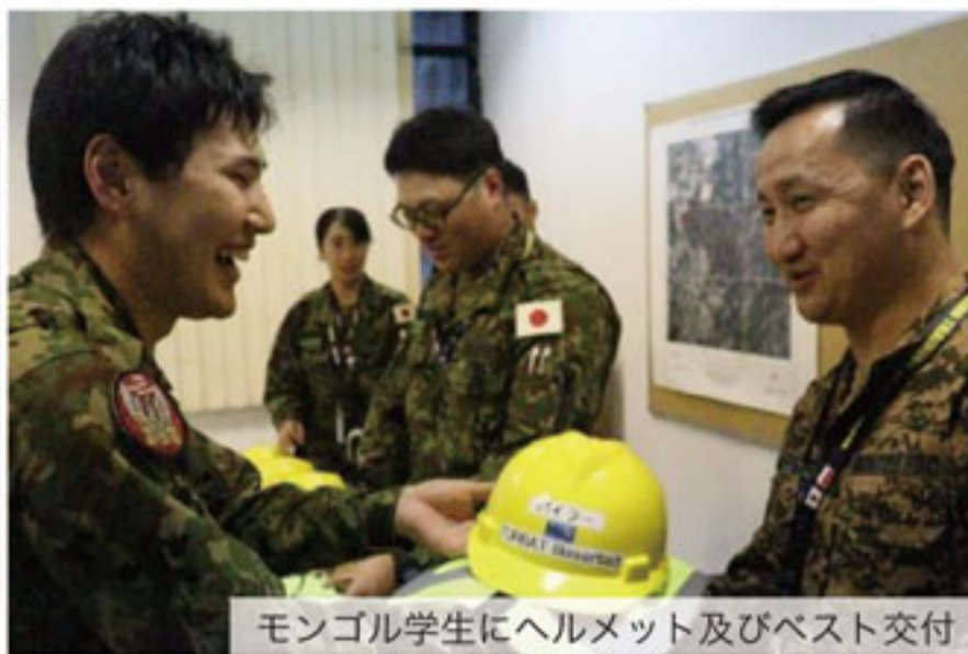
モンゴル学生にヘルメット及びベスト交付