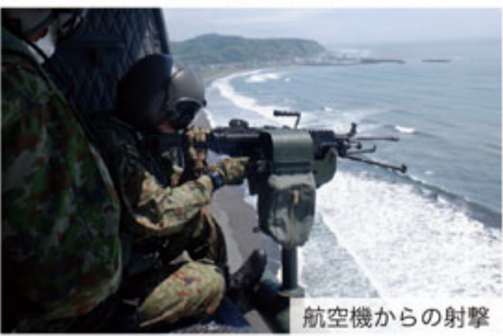
航空機からの射撃