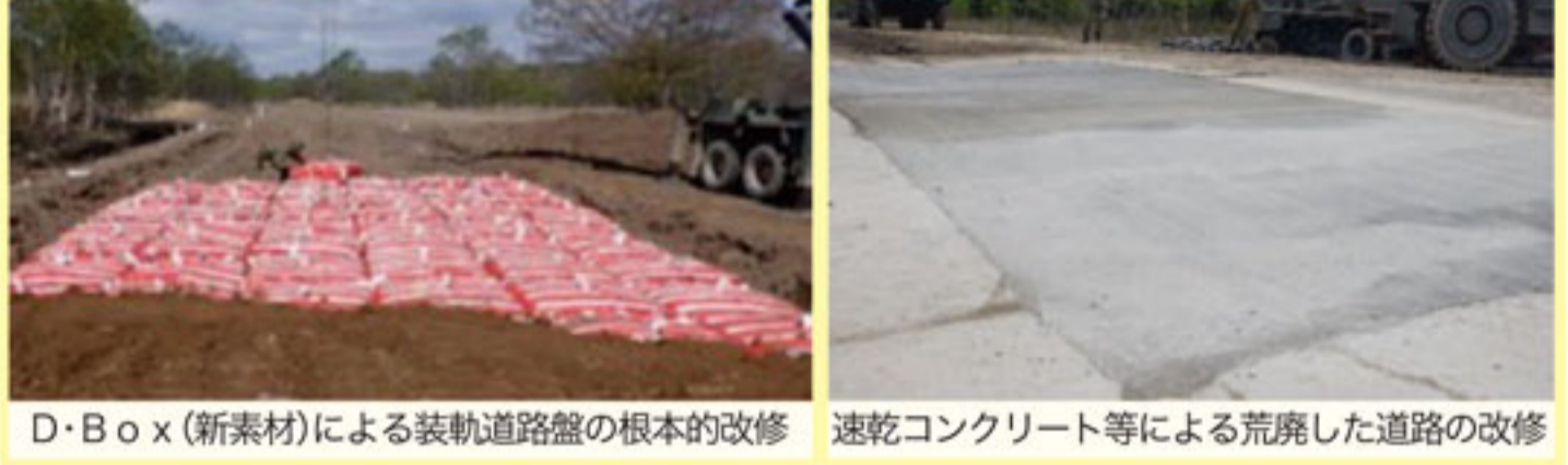
D・Box(新素材)による装軌道路盤の根本的改修 速乾コンクリート等による荒廃した道路の改修