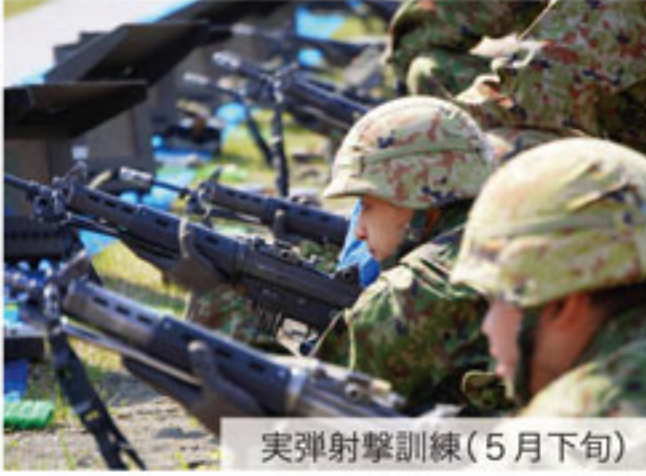
実弾射撃訓練(5月下旬)