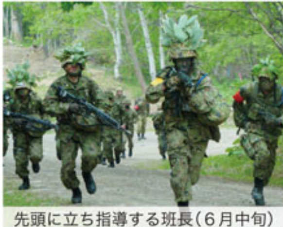
先頭に立ち指導する班長(6月中旬)