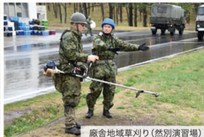
廠舎地域草刈り(然別演習場)