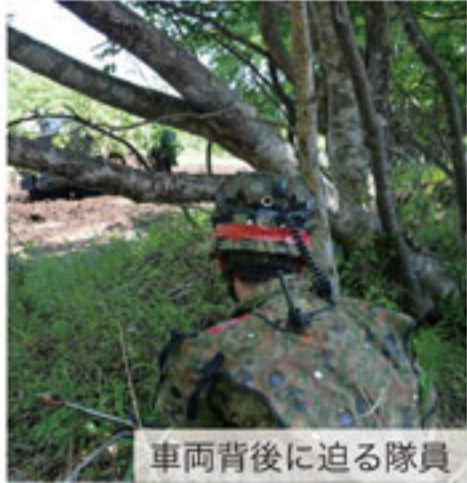
車両背後に迫る隊員