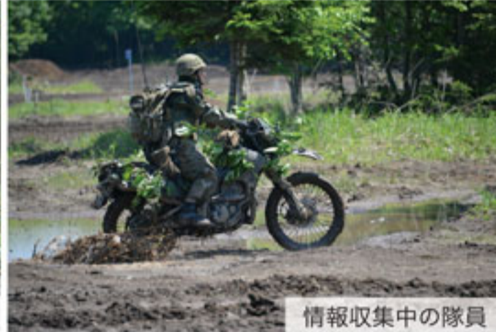
情報収集中の隊員