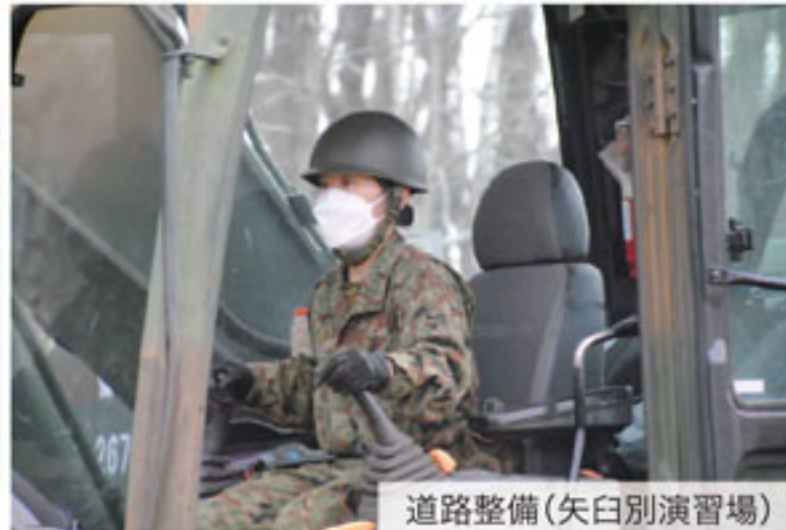
道路整備(矢白別演習場)