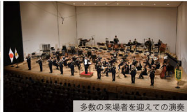
多数の来場者を迎えての演奏