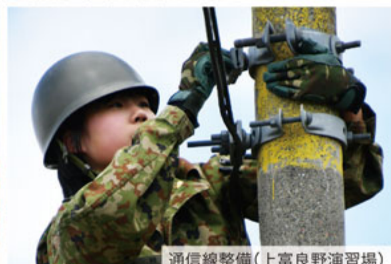
通信線整備(上富良野演習場)