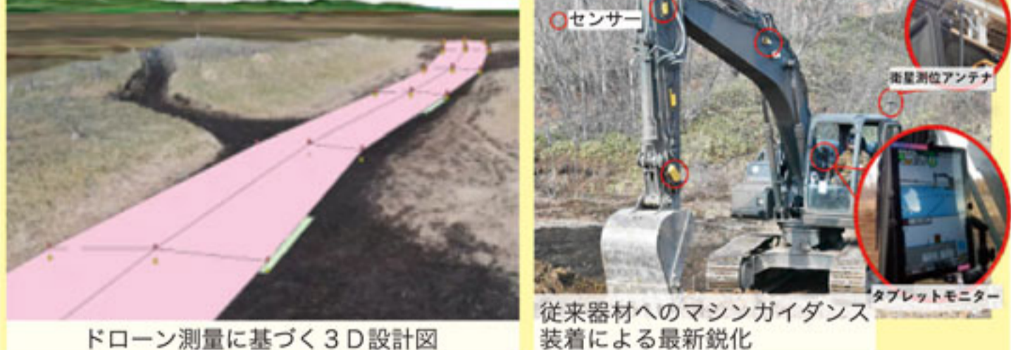
ドローン測量に基づく3D設計図 センサー 従来器材へのマシンガイダンス装着による最新鋭化

北部方面隊の活動はホームページ及び各種 SNS をご覧ください。チャンネル登録及びグッドボタンをよろしくお願いいたします。