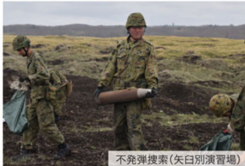
不発弾捜索(矢白別演習場)