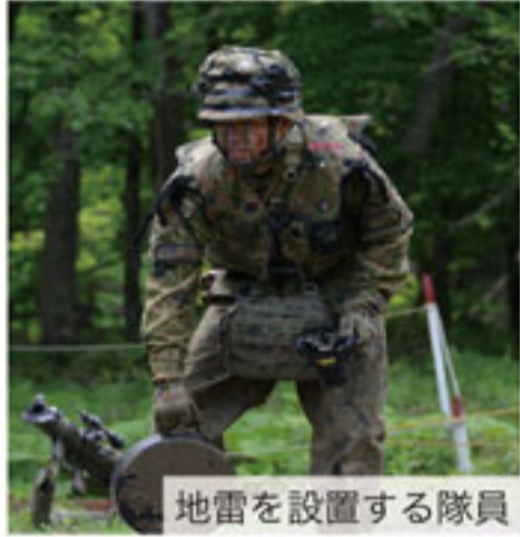
地雷を設置する隊員