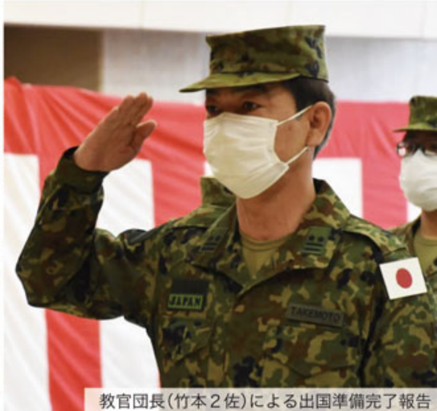
教官団長(竹本2佐)による出国準備完了報告