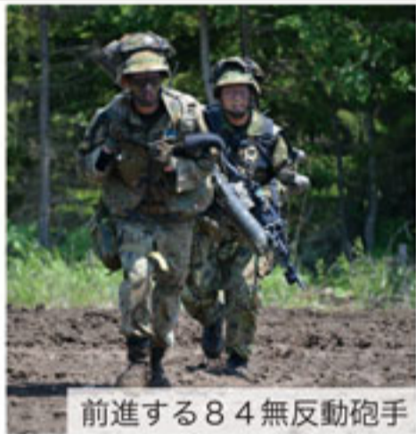
前進する84無反動砲手

第7師団(師団長遠藤陸将)は、6月5日から6月23日までの間、北海道大演習場(恵庭・千歳地区)において、令和5年度機械化部隊戦闘訓練評価センター方式による訓練(ACCITESC)を担任・実施した。 本訓練は、特科や施設等の各職種部隊の協力を受けた戦車中隊、普通科中隊が対抗方式で行う実動訓練で、パトラと呼ばれる訓練装置を隊員・車両に装着し、損害や負傷等の状況をリアルタイムに訓練センターで集約・データ化して、評価分析する等、より実戦に近い環境で行う訓練である。 今回は各師・旅団から26コ中隊が参加し、各級指揮官の指揮能力や各職種の力を結集した総合戦闘力を最大限発揮できるような各種能力の向上を図り、所望の成果を収めた。