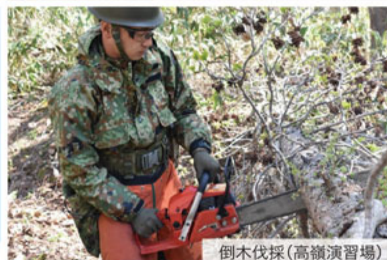
倒木伐採(高嶺演習場)