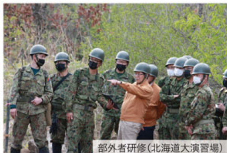
部外者研修(北海道大演習場)