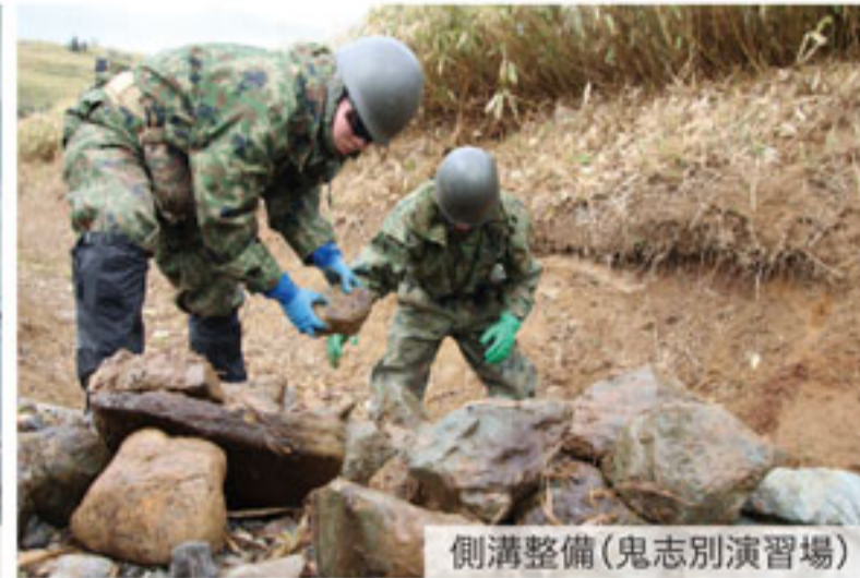
側溝整備(鬼志別演習場)