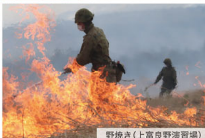
野焼き(上富良野演習場)