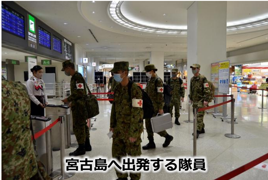
宮古島へ出発する隊員