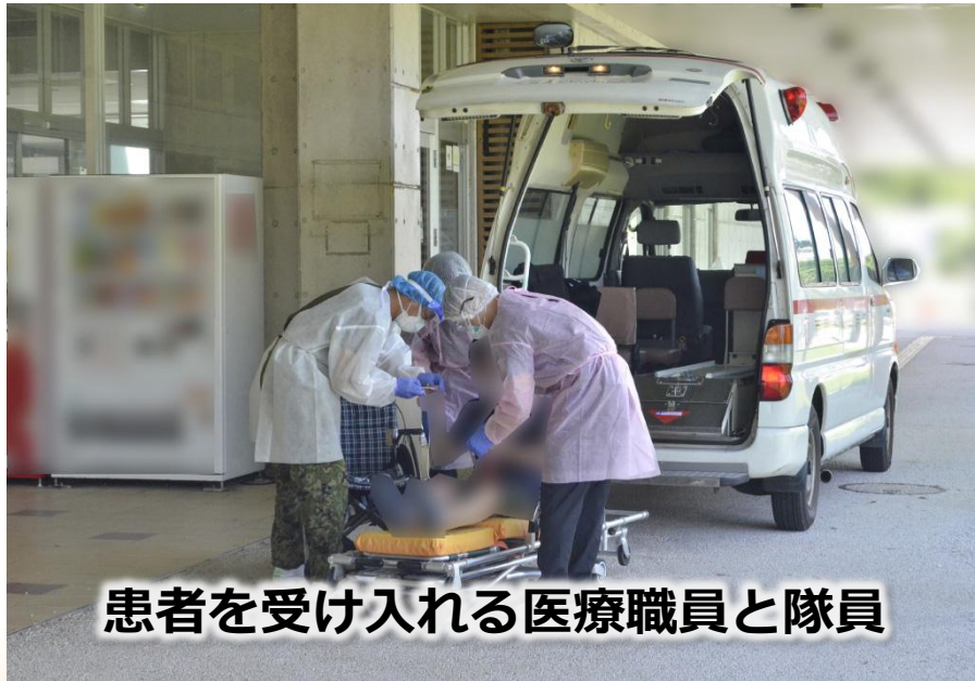
患者を受け入れる医療職員と隊員