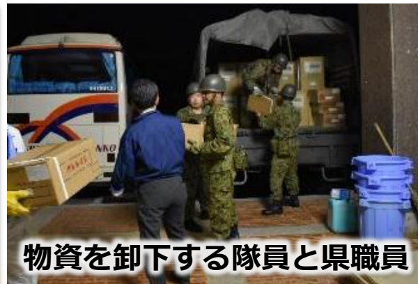
物資を卸下する隊員と県職員