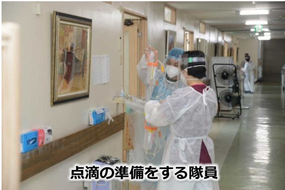
点滴の準備をする隊員