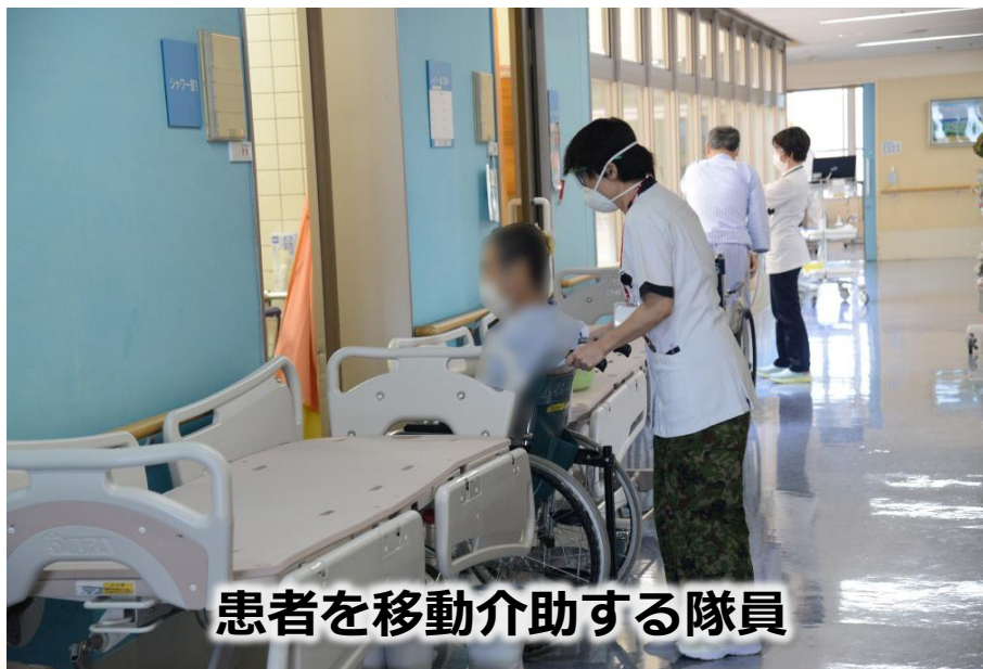
患者を移動介助する隊員