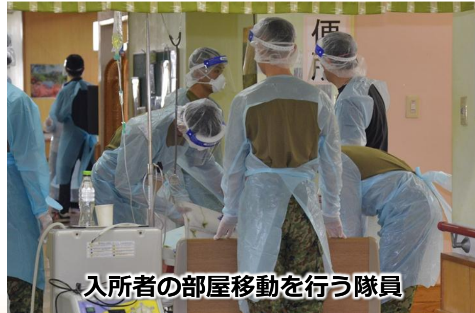
入所者の部屋移動を行う隊員