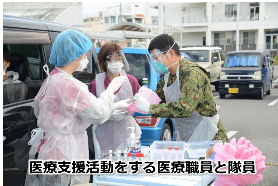
医療支援活動をする医療職員と隊員