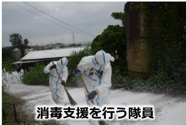
消毒支援を行う隊員