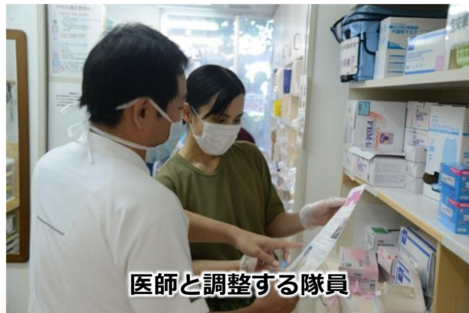
医師と調整する隊員