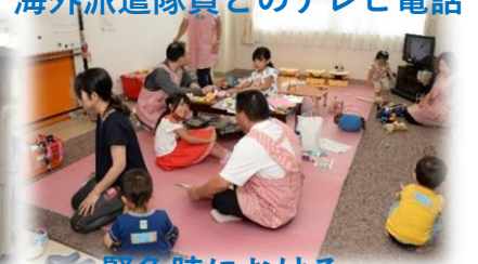
緊急時における 子供の一時預かり