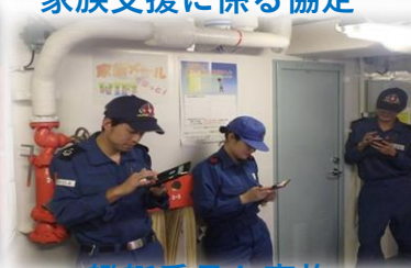
艦艇乗員と家族 とのメール