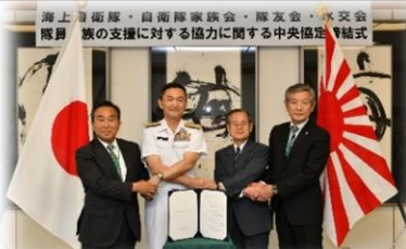
家族支援に係る協定