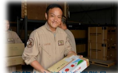
家族から海外派遣隊員 への小包